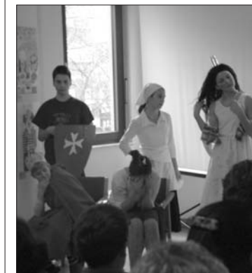
Das Theaterstück sorgte für heitere Grundstimmung

menprogramm. Eröffnet wurde dies von der 6. Klasse der Grundschule „Blanka Teleki“ aus dem XI. Budapester Bezirk mit dem Theaterstück „An allem ist die Katze schuld“. Gekonnt präsentierten die Kinder das eingebaute Stück und sorgten so für die heitere Grundstimmung, die sich über den gesamten Nachmittag fortsetzte. Dem ausgiebigen Applaus für die Darsteller folgten drei Gedichtvorträge – jedes der drei Themen des Wettbewerbs wurde dabei abgedeckt. Daß die Nachwuchsmaler nicht nur über künstlerische Begabung verfügen, bewiesen sie dann im virtuellen Quiz ( den ersten Teil findet ihr auf Seite 6! )