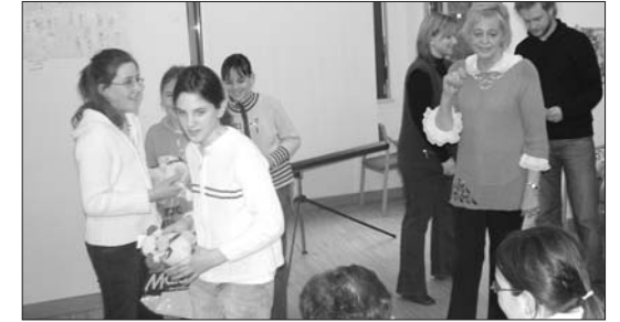
1. Platz für Faschingsplakat-Schülerinnen aus Fünfkirchen

Bunte, grinsende Clowns, jubelnde Fußballstars und mutige Siedler mit ihren Ulmer Schachteln schneiten in den vergangenen Wochen in unsere Redaktion hinein. Aus allen Teilen des Landes beteiligten sich Schulen am Plakatwettbewerb von NZjunior und der ifa-Kulturassistentin im Haus der Ungarndeutschen. Die Schüler in den Altersgruppen bis zur 5. und dann ab der 6. Klasse hatten die Qual der Wahl zwischen den Themen „Die Welt zu Gast bei Freunden – Fußballweltmeisterschaft 2006 in Deutschland“, „Faschingszeit – Die Narren sind los“ und „Ulmer Schachteln – Ansiedlung der Deutschen in Ungarn“, welches bei den Einsendungen leider etwas zu kurz gekommen war. Bei über 120 Plakaten fiel es auch der Jury nicht leicht, die besten zu küren, aber nach langen Diskussionen konnten sich die Juroren auf eine Reihenfolge einigen, so daß am vergangenen Freitag die große Preisverleihung im Haus der Ungarndeutschen in Budapest stattfinden konnte.