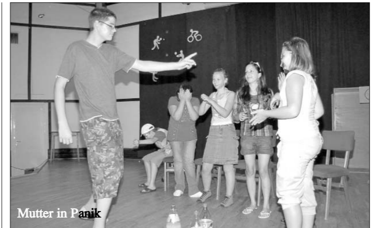
Mutter in Panik

In den Publikumsreihen sah ich Deutsche, Ungarndeutsche und Ungarn. Die jüngste Zuschauerin war 9 Monate alt,