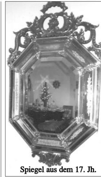
Spiegel aus dem 17. Jh.

Unter König Ludwig XIV wurde 1688 ein Plattengießver-