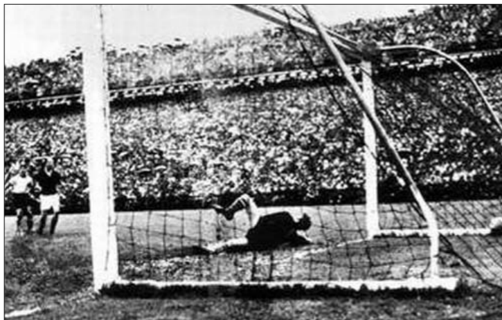
1954 holte die deutsche Fußballmannschaft gegen Ungarn (3:2) ihren ersten WM-Titel. Das Siegestor schoß Helmut Rahn in der 84. Minute.

Über die Fußball-WM in Südafrika lest ihr mehr in der nächsten Nummer!