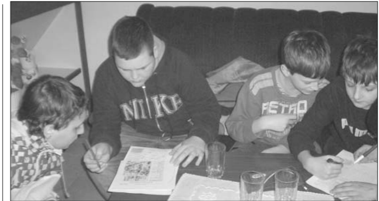
Gruppenarbeit ist wichtig