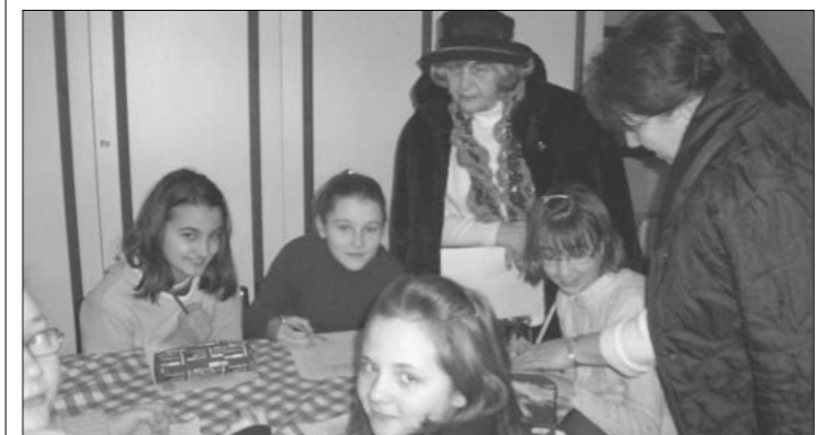
Und, natürlich, etwas Hilfe „von oben“

von der Firma Ferrero Rocher gespendet werden.