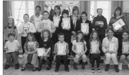
Dier Gewinner in Ödenburg Raab-Wieselburg-Ödenburg

Die Deutsche Nationalitätenschule Ödenburg hat am 29. Januar schon zum 13. Mal den Komitats-Rezitationswettbewerb für die Nationalitätenschulen des Komitats Raab-Wieselburg-Ödenburg veranstaltet, an dem 130 Kinder aus 13 Grundschulen teilgenommen haben. In sechs Kategorien – 1.-2., 3.-4, 5.-6. und 7.-8. Klasse sowie in Mundart Unterstufe und Oberstufe – stellten sie sich den Jurys.