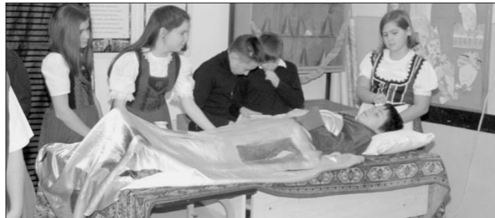
„Restaurant Eierspeisen“ der Ersten Altöfener Grundschule