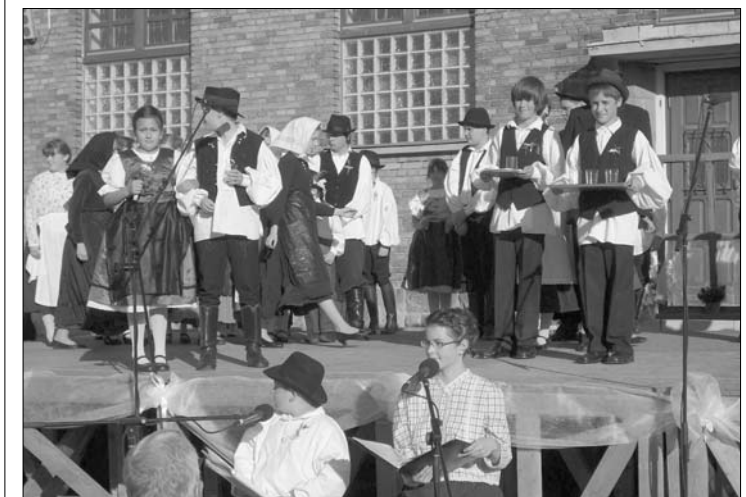
Eine Hochzeit, wie sie sein muß

„Schauspieler“ wurden mit herzlichem Applaus der Zuschauer belohnt.