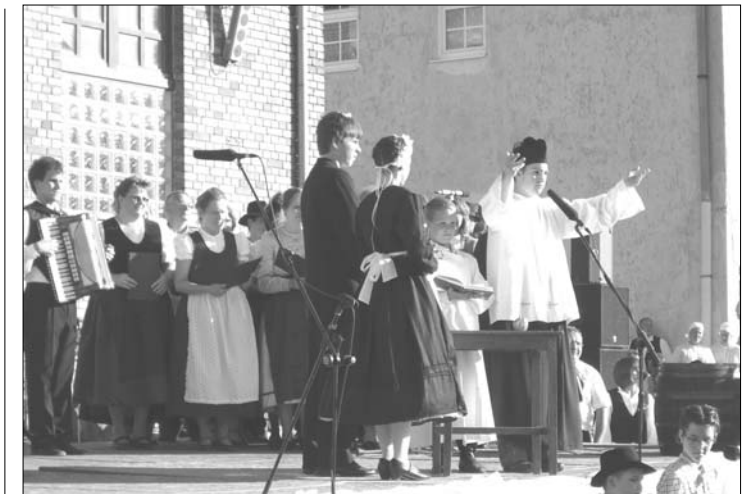
Vor dem Altar