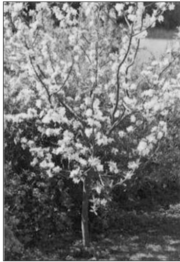
Die Farbe eines Apfels sagt nichts über seinen Geschmack

Der Apfel wächst am Apfelbaum. So ein Apfelbaum kann 15 Meter hoch werden. Im Frühjahr Ende April Anfang Mai ist der Apfelbaum besonders schön. Er ist dann über und über mit kleinen rosaweißen Blüten bedeckt, aus denen sich in den nächsten Monaten die köstlichen Äpfel entwickeln. Die Apfelernte findet bei uns von Mitte Juli bis Oktober statt. Ein guter Apfel duftet an seinem Stiel.