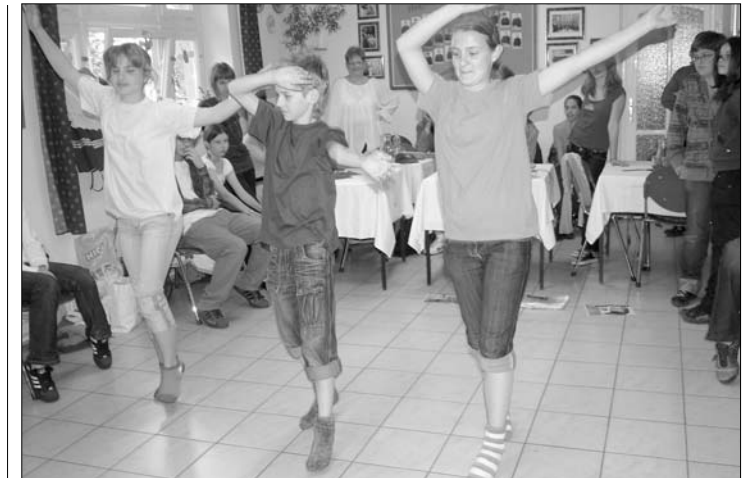
Der „Aldi-Tanz“ der Erstplatzierten „Rotnasen“ aus Fünfkirchen fand viel Gefallen

Acht Tische standen für die acht Mannschaften der Grundschüler aus fast allen Teilen des Landes bereit, die sich auf das Thema „Jung sein ist cool – Teenager gestern und heute“ vorbereitet haben. Der vielversprechende Titel hat auch das Interesse der Wettbewerbsteilnehmer geweckt, die mit viel Spaß und Disziplin die Jury von ihren Kenntnissen in Bereichen wie Volkskunde, Geschichte, Jugendsprache, aber vor allem auch von ihren Sprachkenntnissen überzeugen konnten.