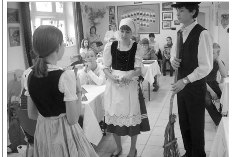
„Kiritog“, die Drittplatzierten aus Tarian, stellen ihren Namen vor

Sehr interessant war die Aufgabe, in der es um Jugendspra-