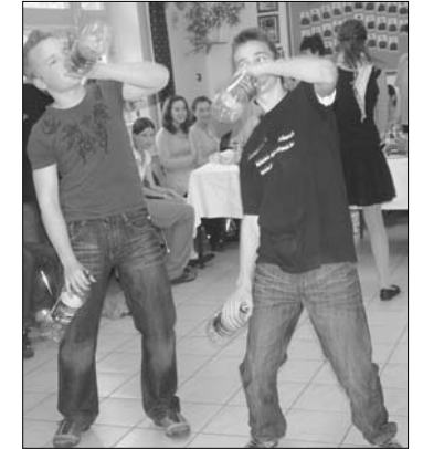
Auch Jungen tanzen gern und gut, bewiesen die Wesprimer (l.) und Ratkaer (r.)