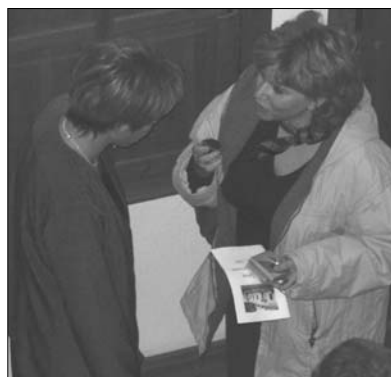
Das erste Interview für NZ

Heute arbeite ich im Haus der Ungarndeutschen im Büro des Ungarndeutschen Kultur- und Informationszentrums und habe auch offiziell viel mit der Neuen Zeitung zu tun, da in NZ regelmäßig über das Zentrum berichtet wird. Die Redaktion ist nur eine Etage höher als das Zentrumsbüro, und besonders dienstags, wenn Redaktionsschluß ist, laufen die Leitungen heiß. Am Donnerstag, wenn die neue Ausgabe in die Redaktion geliefert wird, ist das erste, was alle im Haus machen, sich ein Exemplar zu holen und durchzublättern.