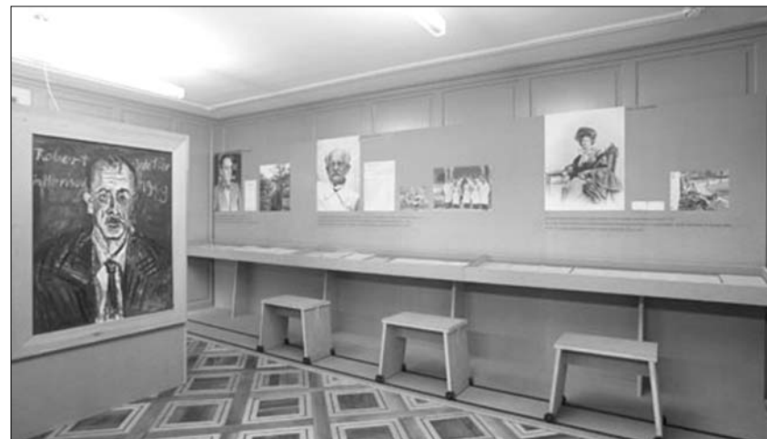
Das Robert-Walser-Zimmer im Museum Herisau