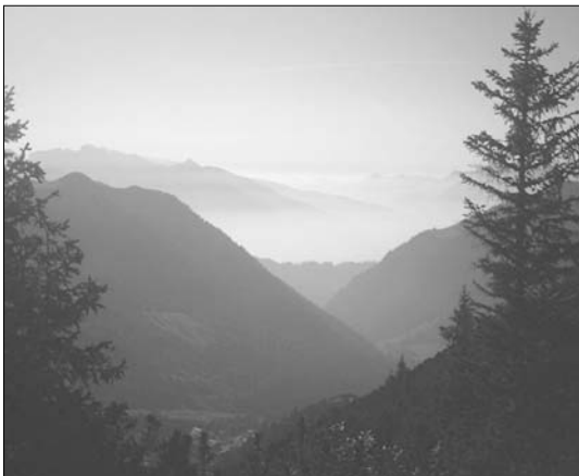
Malbun – eine bezaubernd schöne Landschaft in Liechtenstein

Schloß Kliczkow, Konferenz- und Erholungszentrum Kliczkow 8 59-724 Osiecznica Telefon: 48 (075) 73 40 700/702 Fax: 48 (075) 73 40 703 Marketing: 48 (075) 73 40 708 Internet : www.kliczkow.com.pl E-Mail: zamek@kliczkow.com.pl