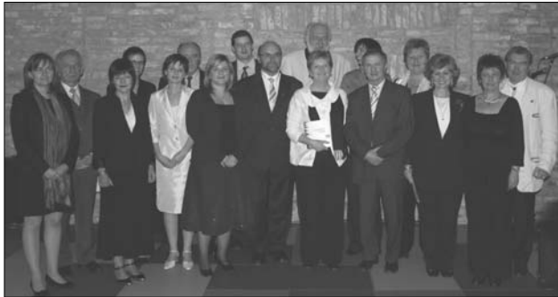
Parlamentspräsidentin Katalin Szili mit den ungarndeutschen TeilnehmerInnen des Festempfangs

Die Rolle der Fernsehsendungen für die Minderheiten in der Bewahrung der Werte dieser Gemeinschaften würdigte Parlamentspräsidentin Katalin Szili beim Festempfang im Wunderlich-Keller von Willand am vergangenen Donnerstag. Am 16. August 1978 wurde die erste Fernsehsendung in deutscher und kroatisch-serbischer Sprache aus dem Regionalstudio Fünfkirchen gesendet. Unser Bildschirm