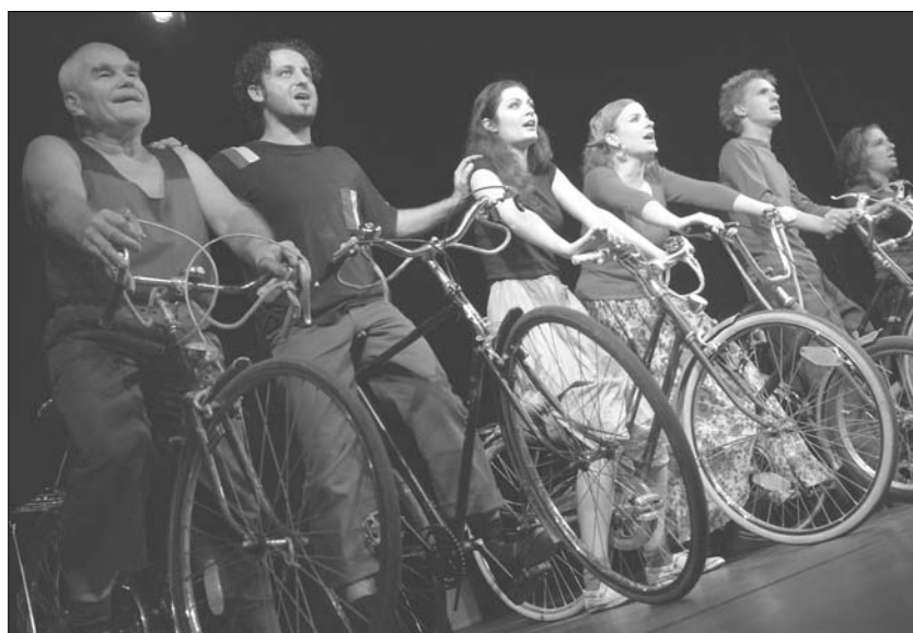
Fahrräder als Pferde

Ins Theater geht man nicht nur, um sich tiefe philosophische Ideen zueigen zu machen, tagelang über ein Stück, ein Schauspiel nachzudenken. Sondern man möchte sich manchmal einfach nur unterhalten, Spaß haben, die Handlung, die Geschichte des Stücks genießen. Genau das kann man erleben, wenn man sich das neue Stück der Deutschen Bühne Ungarn in Sepsárd anschaut.