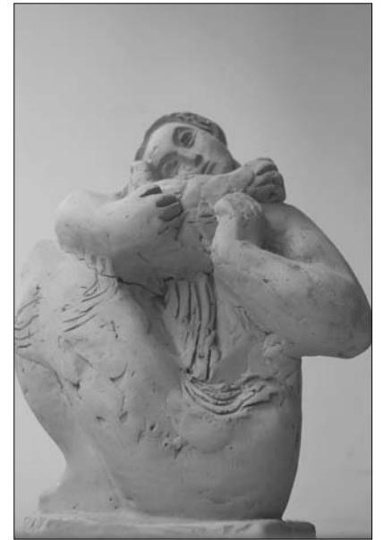
Frau mit Vogel (Entwurf aus Ton)

derhaus oder im Museum für Konkrete Kunst in Ingolstadt. Im Jahre 1975 bekam er in Wuppertal den Dr. Ludwig Lindner-Preis und war seitdem Mitglied des Rings Bildender Künstler aus Nordrhein-Westfalen geworden. In Bad Salzuflen, in der Nähe der baden-württembergischen Hauptstadt Stuttgart, steht seine Monumentalplastik unter freiem Himmel. In seinen siebzig fleißigen und hochproduktiven Lebensjahren schuf er mehr als siebenhundert verschiedene Werke. Ein umfangreicher Katalog ist um die Jahrtausendwende in Temeswar – parallel in rumänischer und deutscher Sprache, mit 1078 schwarz-weißen oder farbigen Reproduktionen – unter dem Titel: „Werkverzeichnis 1963 – 2000“ in der Redaktion der Stiftung Interart Triade erschienen.