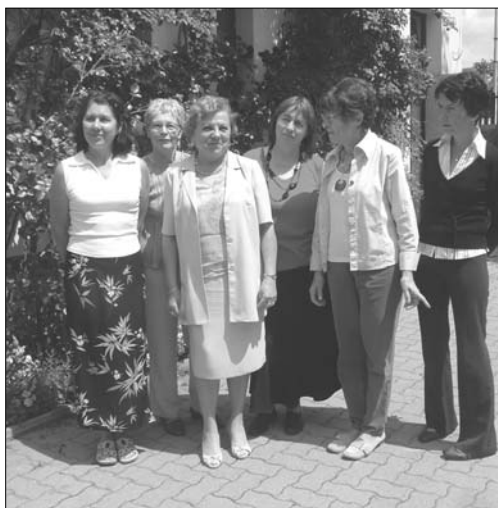
Die neue BUSCH-Leitung

Der Schulvereinstag am 26. Juni stand ganz im Zeichen der Abschlusveranstaltung des 120 Blockeinheiten umfassenden, akkreditierten Fortbildungslehrganges im Fach ungarndeutsche Volks-