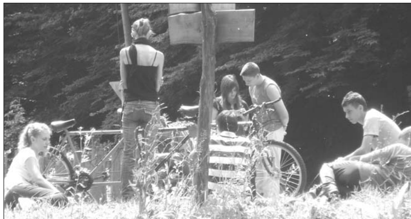
Raststunde beim Radfahren