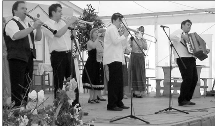
Die Kapelle der Stimmungsparade

Die Organisatoren hatten auch an die Kleinen gedacht. Und für Humor