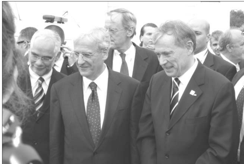
Staatspräsident László Sólyom und Bundespräsident Horst Köhler besuchten die Veranstaltungsreihe „Deutschland sagt Danke“