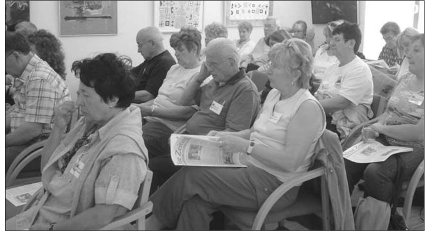
Die Reisegruppe im Budapester Haus der Ungarndeutschen

machen sie eine Reise zu den Donauschwaben in der Welt, um zu sehen, wie diese ihre Kultur pflegen bzw. wie sie leben. Nach den ersten zwei Reisen, die sie nach Ungarn führten, flogen sie vorletztes Jahr in die USA zum Welttreffen der Donauschwaben, letzten Winter besuchten sie die Donauschwaben in Brasilien und dieses Jahr sind vom 12. – 21. Juni erneut die ungarndeutschen Ortschaften an der Reihe. Im HdU erfuhren die Gäste von den Gastgebern alles über das Haus, die hier ansässigen Vereine und Institu-