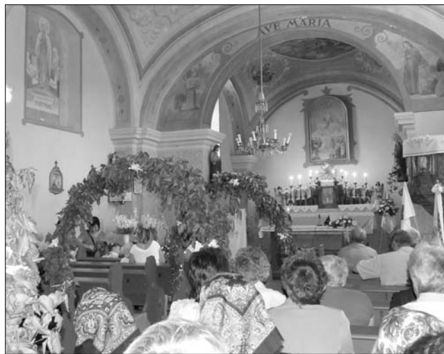
Die Kirche in Boden

Der Vormittag gehörte den Kindern und Jugendlichen, Sportprogramme und Unterhaltung für Kinder lockten die Familien zum Fest. Mit dem Lied „Mit frohem Herzen will ich singen“ stimmten die Bawazer Musikanten zum Festgottesdienst ein. Nach der deutschsprachigen heiligen Messe ging die kleine Gruppe zur Prozession und mit Musikbegleitung besuchte sie die vier festlich geschmückten Stationen. Es wurde ein neues Denkmal zu Ehren von Kriegsoffern und Verschleppten eingeweiht. Und mit der Eröffnung der Ausstellung über die Stadt Unterschleißheim begann das Kulturprogramm