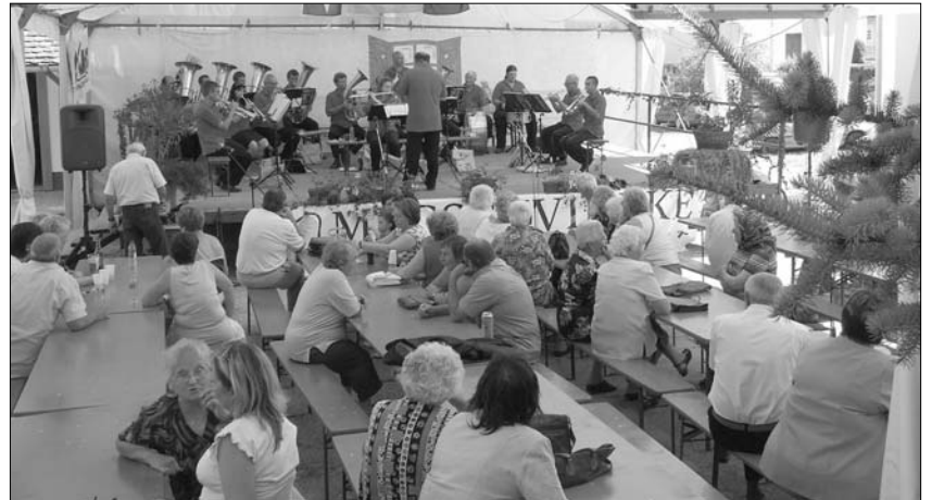
Das Festzelt mit Blasmusik aus Maza

In Ofala ist es immer lustig und in Ofala ist es immer familiär, so lautet die Meinung der Besucher, die von diesem kleinen Dorf inmitten wunderschöner Berge und Wälder geradezu magisch angezogen werden. Ob es die Blasmusik, der Tanz, die Menschen oder die Salzkipfel sind, oder alles zusammen, Ofala ist einen Besuch wert.