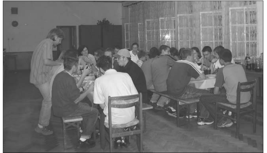
Die Ofalaer Hecketapper bei der Gründung des GJU-Freundeskreises