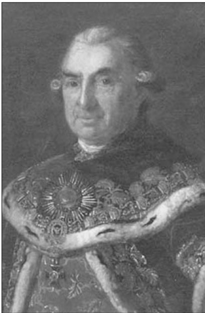
Martin Meytens: Samuel von Brukenthal (18. Jahrhundert)

Außer dem virtuell nachempfundenen Wohnhaus Kazinczys oder Möbeln und Objekten aus seinem Besitz zählen wirklichkeitstreue Nachbauten von Kazinczys Ar-