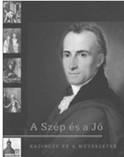
Johann Nepomuk Ender: Ferenc Kazinczy (1830-1833)