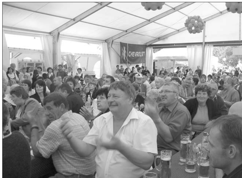
Im Festzelt in Saksard

Ein Besuch beim Autohaus Hilcz brachte die Erkenntnis, daß sich Beharrlichkeit und Ehrlichkeit in Verbindung mit einem gesunden Unter-