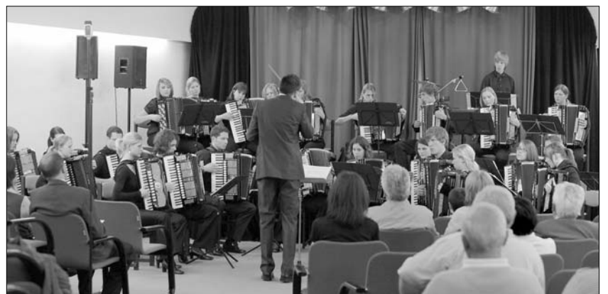
Das Akkordeon-Jugendorchester des Landes Baden-Württemberg gastierte zu Pfingsten in Ungarn und gab Konzerte in der Kirche von Waschkut, in der Redoute von Bohl und im Haus der Künste in Fünfkirchen.