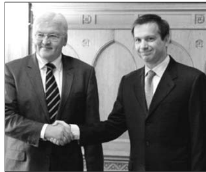
Steinmeier mit Ministerpräsidenten Gordon Bajnai

Bei seiner Rede in Budapest setzte sich der deutsche Vizekanzler so deutlich wie nie zuvor von der Europapolitik der Kanzlerin ab, was noch dadurch unterstrichen wurde, daß er dies im Ausland tat. Der 53jährige SPD-Politiker plädierte für eine stärkere Abstimmung der Euro-Länder in Wirtschaftsfragen und damit für einen Vorschlag Frankreichs. Merkel hatte in der Vorwoche eine stärkere