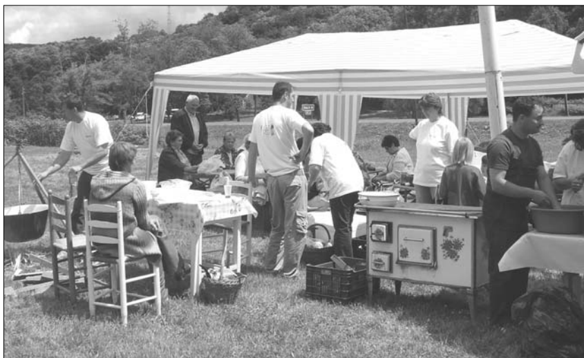
Die Bikaler und ihr Sparherd

Jedes Jahr kommen mehr Menschen von nah und fern, um in Nadasch unter Kastanienbäumen das Fest rund ums traditionelle Gockelpaprikasch zu genießen. Über 2.000 Menschen waren in diesem Jahr neugierig auf die siebte Auflage des Wettkochens, das vom Tourismusverein „Perlen des Östlichen Mecseks“ organisiert wird, der seit vielen Jahren Traditionspflege betreibt.