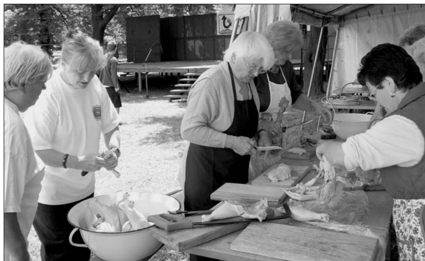
Nadascher Rentner fuhren schweres Geschütz gegen den Gockel auf

Als Hilfestellung für alle Köche war vorab ein Originalrezept des traditionellen Gockelpaprikasch verteilt worden. Selbst ältere Menschen, die das Gericht noch bestens kennen, verwenden inzwischen moderne Zusätze wie Delikat oder Pi-