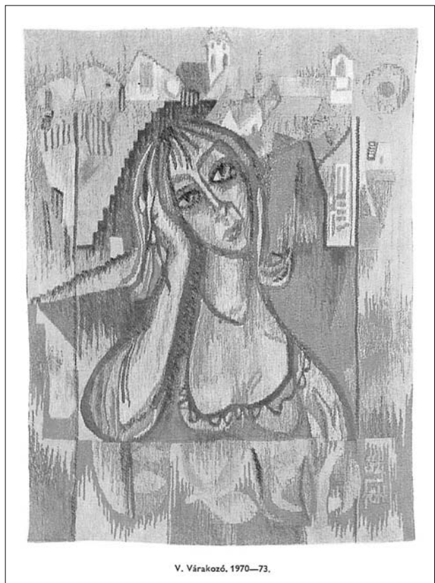
V. Várakozó, 1970—73.