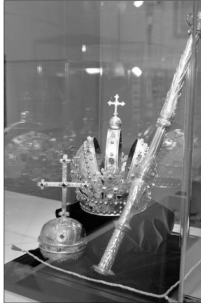
Funeralinsignien der römisch-deutschen Kaiser und Könige

Aus dem Prager Domschatz sind weiters die Funeralinsignien (von 1576-77) der römisch-deutschen