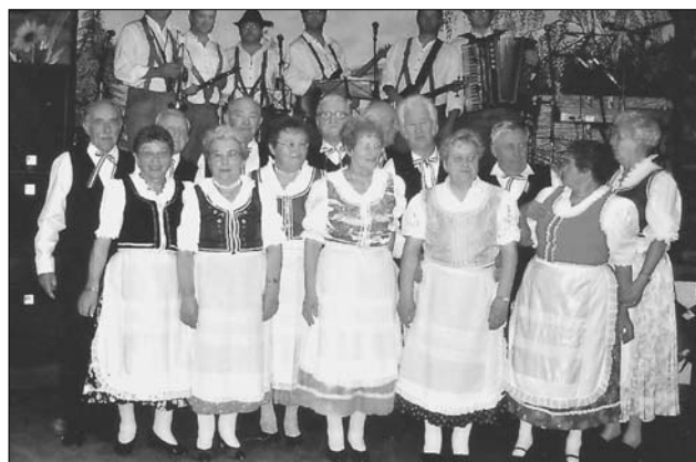
Vogtländische Schwaben beim Schwabenball im Landhotel Lichte Aue bei Auerbach. Im Hintergrund: die Schützkapelle aus Boschok.

Jedes Jahr setzen sich die Auerbacher „Schwaben“ in den gemeinsam angemieteten Reisebus und besuchen die angestammte Heimat. Standquartier nehmen sie wie stets in Taks bei Budapest. Von dort aus unternehmen sie dann täglich Stippvisiten in die Heimatorte oder zu anderen ungarischen Zielen.