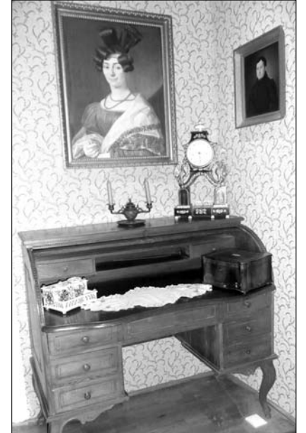
Bürgerzimmer in der Region Horácko Ende des 19. Jahrhunderts

In der tschechischen Stadt Telc, ein UNESCO-Weltkulturerbe, sind im Museum vor allem heimatkund-