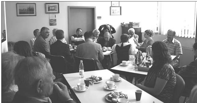
Lesung in der Stafette in der Bibliothek des Temeswarer Adam-Müller-Guttenbrunn-Hauses

Der Sammelband gewährt Einblick in das Schaffen der Mitglieder des Literaturkreises, dabei sind sowohl Lyrik- als auch Prosawerke, bzw. Rezensionen über Neuerscheinungen vertreten. Neben den aus den