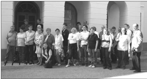
Teilnehmer der Literaturtage vor dem ältesten Theater Rumäniens