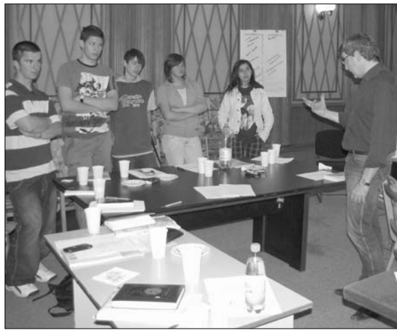
Der Medientrainer erklärt

Es mag selbstverständlich sein, daß im Radio der Moderator oder der Reporter gut sprechen kann. Es ist aber gar nicht so einfach, Texte schön zu formulieren, Wörter gut zu betonen und auszusprechen sowie richtig zu artikulieren. Radiosprache sprechen – das war der Titel und das Thema eines Workshops zwischen dem 8. und 10. Mai im Rundfunkgebäude von Neumarkt in Rumänien, organisiert vom Institut für Auslandsbeziehungen sowie der deutschen Redaktion von Radio Neumarkt. An der Bildung haben erfahrene, aber auch junge und angehende Journalist/innen von deutschsprachigen Rundfunksendungen aus Rumänien und Ungarn teilgenommen.