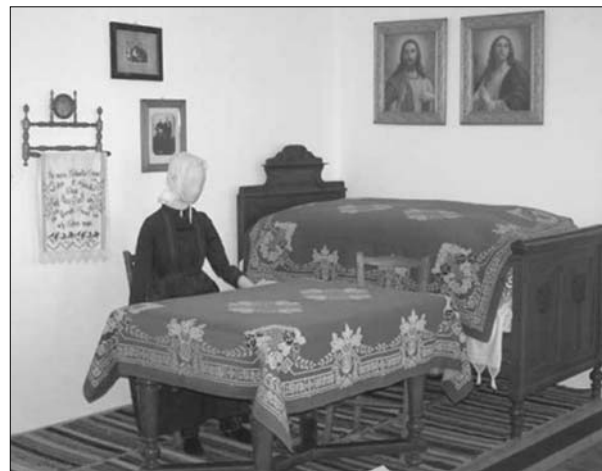
Deutsches Zimmer im Museum Völgység