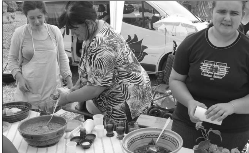
Die Altglashüttener bieten Bohnen, Hefeklöße, Hutzel und Wein an