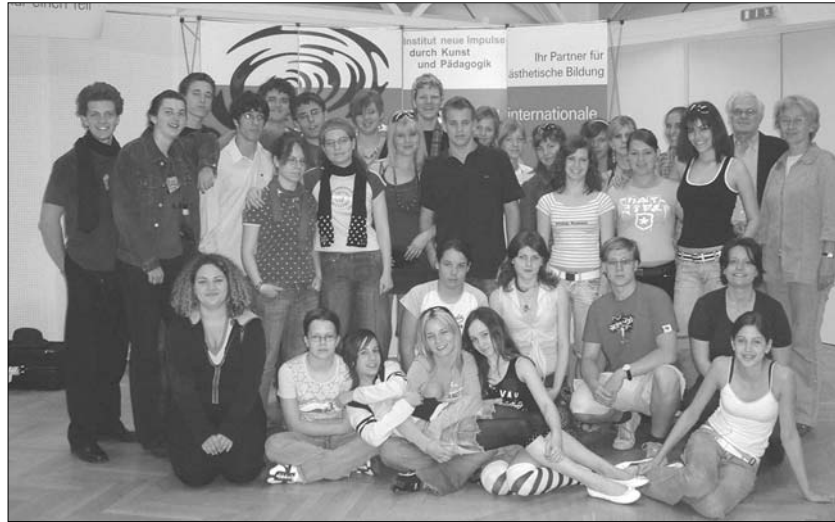
Die Teilnehmer aus Ungarn

Zwischen dem 26. und 28. April wurden Schülerinnen und Schüler aus Österreich und anderen europäischen Staaten eingeladen, Projekte zum jeweiligen Thema künstlerisch zu erarbeiten und diese im Rahmen eines Wettbewerbs der Öffentlichkeit zu präsentieren. Das Apropos zum diesjährigen Thema gab die Ablehnung der EU-Verfassung durch die Franzosen und Niederländer im Mai und Juni 2005. So wählte man zum Leitmotiv der 11. Schiller-Gespräche das Zitat Friedrich Schillers: „Der Staat kann nur so vollkommen sein wie der Bürger, der ihn trägt.“