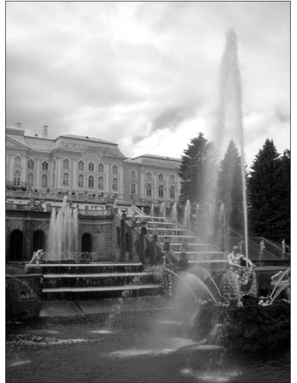
Die Große Kaskade in Peterhof

An den Kreuzungen der vielen Alleen im Unteren Park und vor den großen Kaskaden finden sich symmetrisch angeordnete Springbrunnen, von denen jeder einzelne für sich schon ein beachtliches Kunstwerk darstellt: die mit einer Nymphe und einer Danaide geschmückten Fontänen „Marmorbänke“, die Marmorplastiken „Adam“ und „Eva“, von je 16 mächtigen Wasserstrahlen umgeben, im Ost- und Westteil des Unteren Parks plaziert. Allein von diesen beiden im Verhältnis eher kleinen Brunnen mit ihren achteckigen Wasserbecken füh-