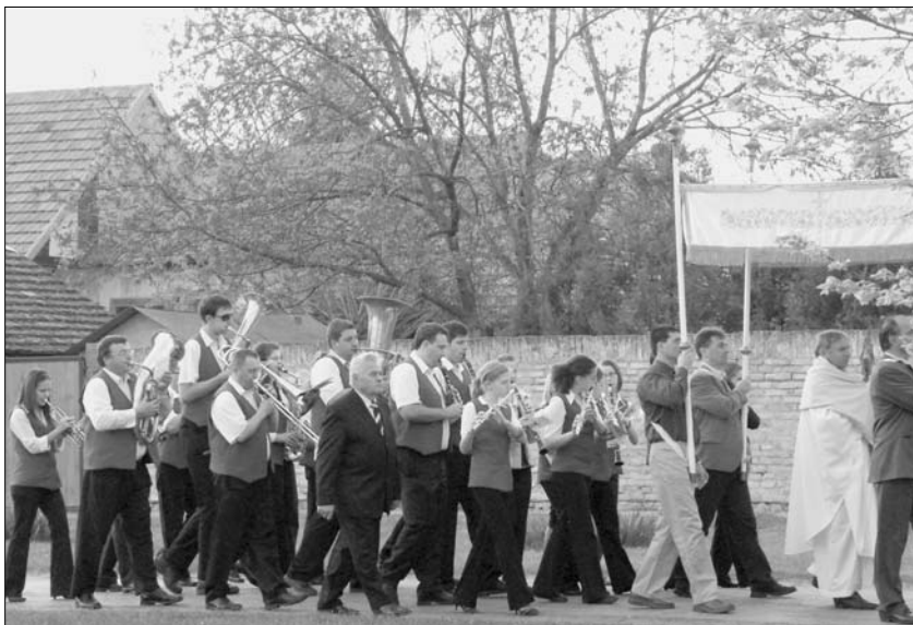
Osterprozession und Kalvarienberg in Waschkut