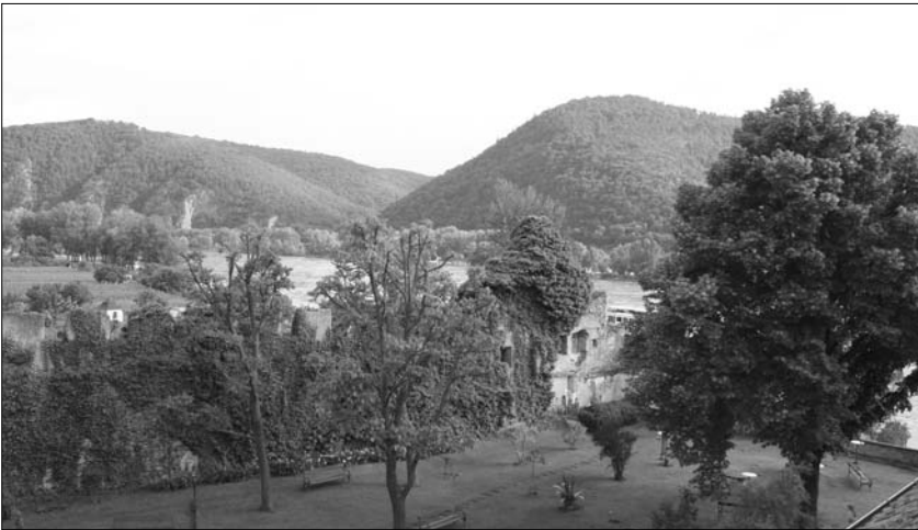
Die Wachau bei Dürnstein