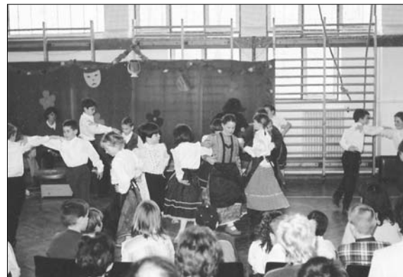
Traditionspflege in der Schule von Rendek

Im Jahre 1941 bekannten sich 945 von den 1001 Einwohnern zur deut-