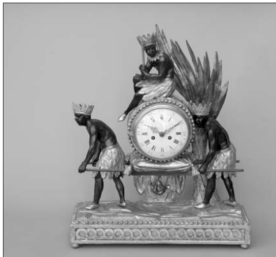
Österreichische Tischuhr (Ende des 18. Jahrhunderts) mit bemalten und vergoldeten Holzfiguren

*Barbara Reiter – Michael Wistuba: Budapest. Michael Müller Verlag, Erlangen, 2007, S. 256