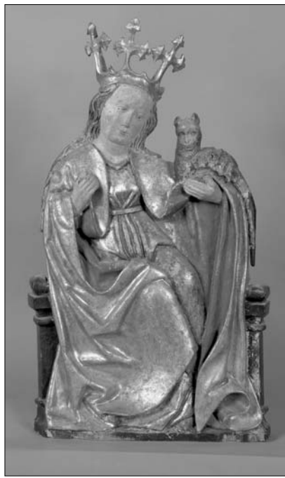
Süddeutscher Meister: Die Heilige Margareta (zweite Hälfte des 15. Jahrhunderts), Lindenholz bemalt und vergoldet

Diesmal haben die Organisatoren aus 2000 eingebrachten Kunststücken fast 600 Exemplare von 65 Kunstsammlern ausgewählt, die bis 20. April im Erdgeschoss des Palastes in der Üllői-Straße, sortiert nach Chronologie und Benutzungsart, zu besichtigen sind. Wegen der wohlbekannteren historischen Gründe ist auch heutzutage nicht verwunderlich, daß aus dem aktuellen Besitz der zeitgenössischen ungarischen Privatsammler eine Menge von Prachtstücken deutscher Herkunft aufgetaucht ist. Aus dem Mittelalter bis zur Gegenwart können wir zahlreiche Raritäten entdecken, um die das Gastgebermuseum die Sammler beneiden könnte. So eines der ältesten Stücke der repräsentativen Ausstellung, das holzgeschnittene Relief eines unbekannteren Meisters vom Niederrhein über die heilige Anna aus der zweiten Hälfte des 15. Jahrhunderts oder eine andere Heilige aus Niederbayern (um 1520), die