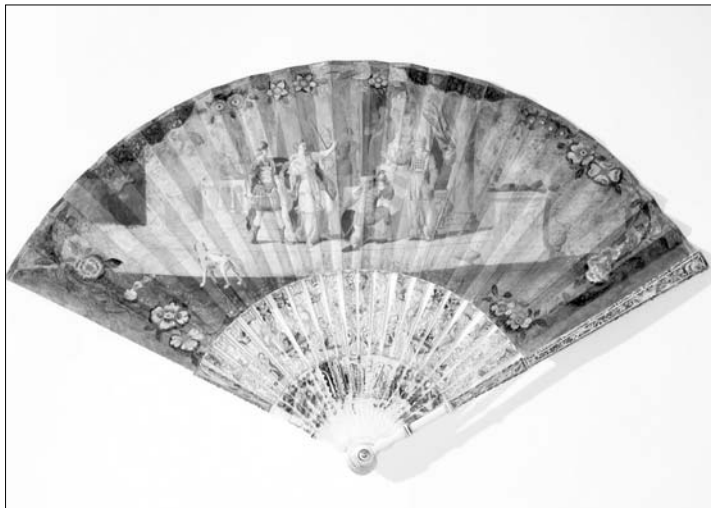
Österreichischer Fächer mit biblischer Szene (um 1730) aus Pergament, Elfenbein und Perlmutter