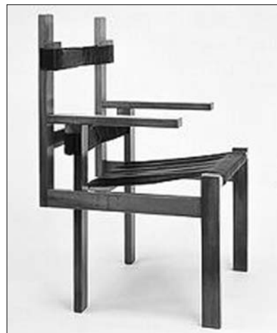
Marcel Breuer: Lattenstuhl (um 1924)

Frisch maturiert meldete sich Marcell Breuer im Jahre 1920 an der Akademie der Künste in Wien, verließ aber gleich wieder die –