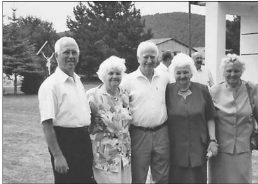
Mit Angehörigen auf dem Friedhof

Wenn er nun zurückschaut auf sein Leben, dann freut ihn vor allem, was er für andere, für die Allgemeinheit tat. Und er ist stolz auf das behagliche Anwesen, das er seiner Familie fern der einstigen Heimat schuf: Ein schönes Haus mit gediegener Einrichtung, in dem er mit seiner Frau und seinen drei, inzwischen erwachsenen Söhnen wohnt. Aber immer quält ihn auch Bitterkeit, die Vertreibung aus dem Paradies der Kindheit in Band kann er nicht verwinden.