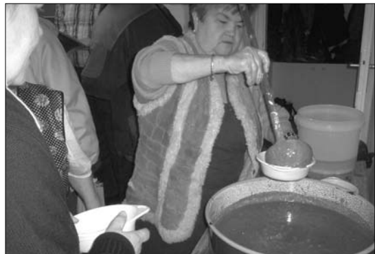
Mittagessen: Saures nach Großturwall Art