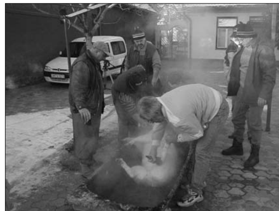
Schweineschlachten in Organisation der Sektarders Deutschen Selbstverwaltung

Ein Oberschlächter (aus Gowisch stammend) berichtete, bei ihm seien