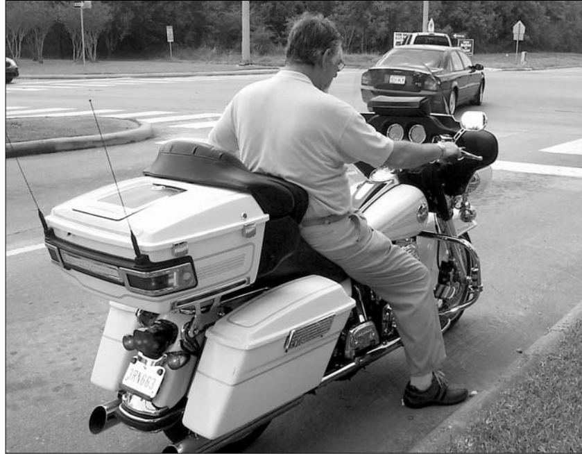
Motorradfahrer knattern mit 120 km/h ohne Helm, mit Sonnenbrille, wehendem T-Shirt im Nacken und Flip-Flops an den Füßen.

Die Mehrheit der 23 Millionen Einwohner hockt ständig in ihren großen Pickups und drückt das Gaspedal. Da die automatische Gangschaltung die rechte Hand freistellt, hält diese entweder ein Handy ans Ohr oder einen überdimensionalen Kaffeebecher. Ist er