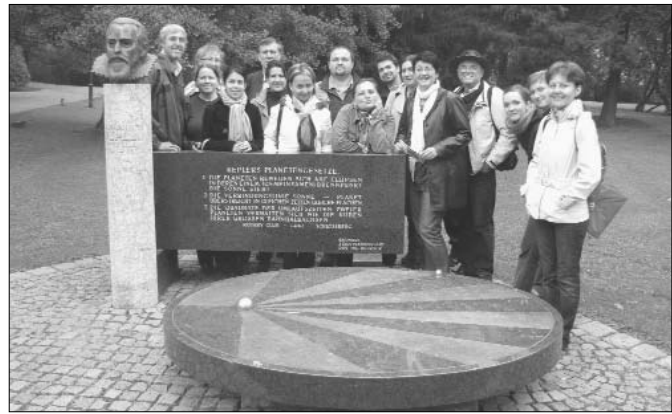
Einige Teilnehmer vor dem Kepler-Denkmal in Graz

Vom 30. September bis 2. Oktober besuchten 23 LehrerInnen aus 15 ungarischen Schulen und Institutionen das Schulzentrum Klusemannstrasse in Graz. Die Schule ist eine kooperative Modellschule, an der zahlreiche Innovationen entwickelt und dauerhaft installiert wurden. Sie beginnt mit der Jahrgangsstufe fünf und kann bis zum Abitur besucht werden.