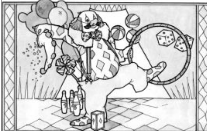
Clown Beppo tritt zweimal auf. Bei seinem zweiten Auftritt hat er Pech. Was ist passiert?