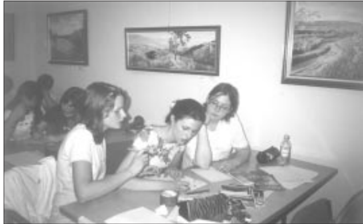
Der 2. Platz ging an „Piz Gloria“

Vorbereiten konnten sich die Teilnehmer mit Hilfe ihrer Lehrer anhand von verschiedenen Materialien, die die Schweizer Botschaft zur Verfügung gestellt hat. Das Vorspielen des Namens und die Reise durch die Schweiz waren Hausaufgaben. Alle Gruppen hatten sehr fleißig gearbeitet und viel ihrer Freizeit für die Vorbereitung geopfert, ebenso wie die Lehrer. Beim Wettbewerb selbst waren alle diszipliniert und wetteiferten ernsthaft um die Platzierungen.