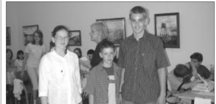
Die Schmutzlis fahren in die Schweiz

Am 9. Mai war es wieder soweit: Schmutzlis, Schweizer Taschenmesser, Hornissen, Petri Heil und Petri Dank, Guggenmusiker, Piz Gloria, Die Uhrmacher und zweimal Wilhelm Tell , neun Schülergruppen zu je drei „Mann“ mit phantastischen Namen aus verschiedenen Landesteilen trafen sich im Haus der Ungarndeutschen in Budapest zum nun schon dritten Landeswissenswettbewerb, veranstaltet von NZjunior und dem Bund Ungarndeutscher Schulkvereine. Thema war die Schweiz.