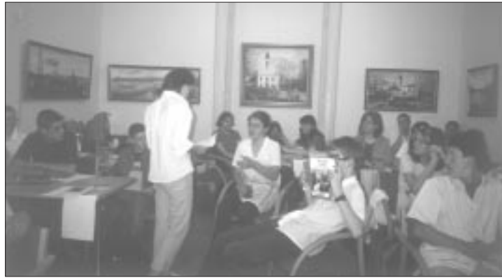
Den 3. Platz belegte das „Schweizer Taschenmesser“

Aber selbstverständlich ging es hier nicht nur um Plätze. Der eigentliche Nutzen des Wettbewerbs für die Teilnehmer ist und bleibt das Wissen, das sie sich in diesem Falle über die