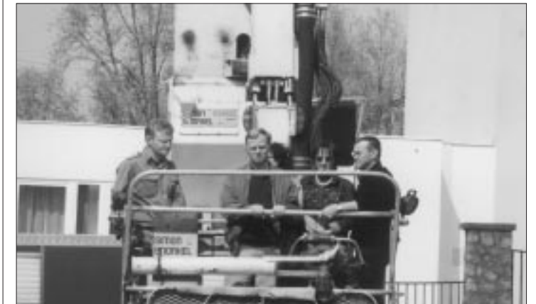
Die deutschen Gäste bei der Feuerwehr in Tatabánya

te ihnen stolz unseren Kindergarten, die Nationalitätengrundschule, die Wallfahrtskirche. Sie besichtigten Bauarbeiten, es entstehen ja neue Fußgängerwege, Parkanlagen und ein Spielplatz. Momentan werden die Fenster der Grundschule ausgewechselt, dann erfolgt der Außenputz in den Sommerferien. Auch das alte Schulgebäude wird erneuert, da möchte man ein Erwachsenenbildungszentrum einrichten.