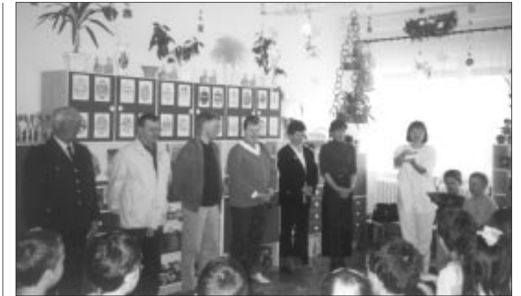
Besuch im Kindergarten

Man führte lange Gespräche über Ausbaumöglichkeiten der Partnerschaft mit Vereinen, Kindergarten und Schule. Man zeig-