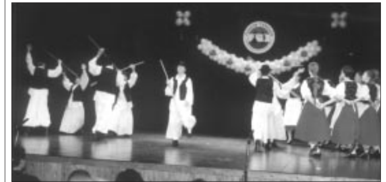
Hirtentanz aus dem Bakony-Gebiet

Mit von der Partie waren auch die Kinder vom Nachbarkindergarten.