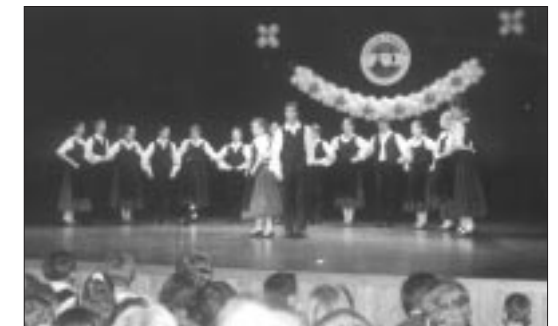
Hajoscher Tänze (Junioren-Tanzkreis)