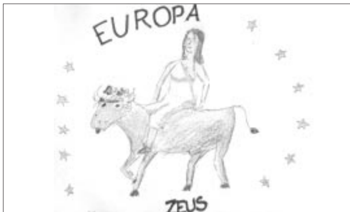
Zeichnung der Gruppe aus Dombóvár

So lebten sie glücklich zusammen und hatten drei Söhne: Minos, Radamanthys und Sarpedon. Die Griechen liebten Europa sehr und benannten alle Länder, die sie später entdeckten, nach ihrem Namen. So entstanden viele Länder mit vielen unterschiedlichen Sprachen und Kulturen. Diese bilden den heutigen Kontinent Europa.