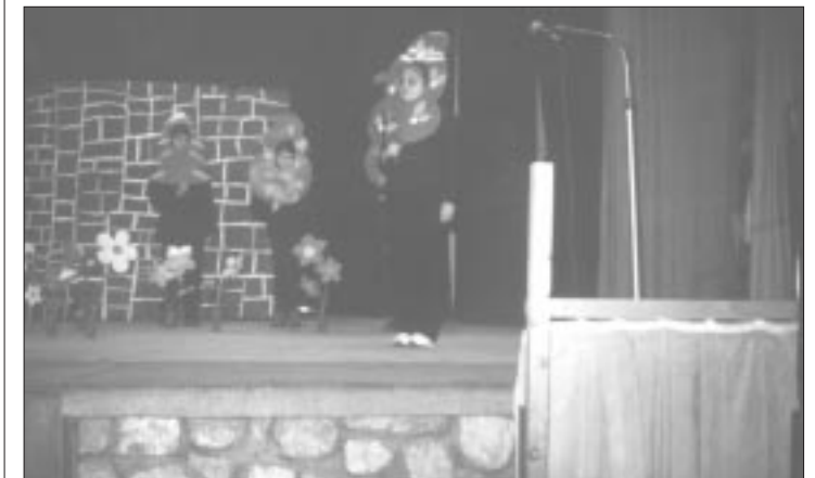
„Die Schule mit den Bäumen“ zeigte die Gruppe aus Widege