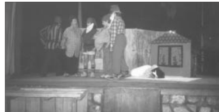
Die Zwerge und Schneewittchen verstehen etwas vom Theaterspiel