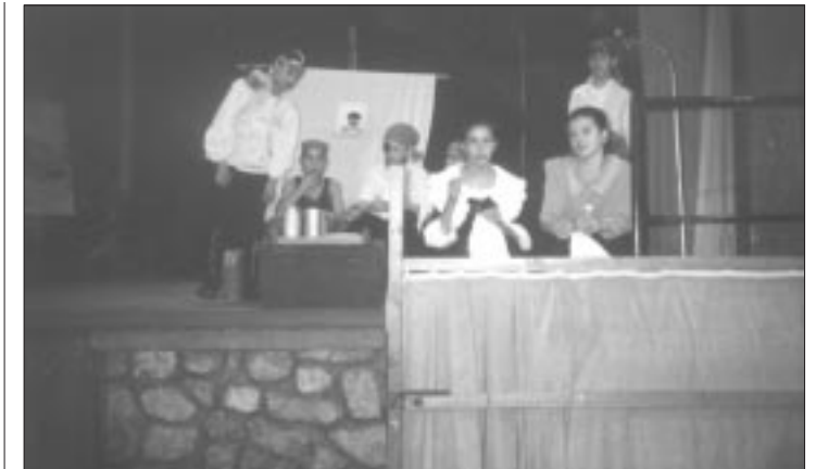
Das Piratenlied der Kischludter fand großen Anklang

Das nun schon traditionelle Dramenfestival in Ugod bot auch in diesem Jahr wieder allen anwesenden Teilnehmern und Zuschauern einen unterhaltsamen und abwechslungsreichen Tag.