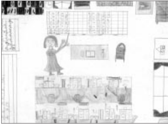
Zsuzsanna Ebele Gyulaffy-Grundschule, Veszprém-Gyulafirátót