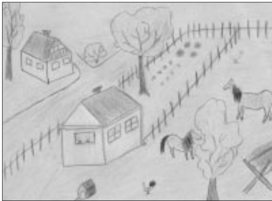
Judit Kormos Gyulaffy-Grundschule, Veszprém-Gyulafirátót