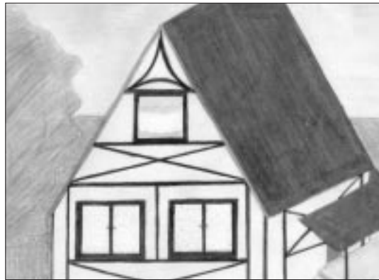
Aniko Miricz Visontai-Kovács-László-Grundschule, Vámosgyörk