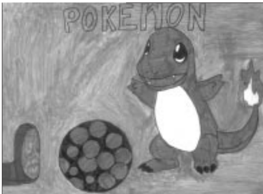
Csaba Spérk Grundschule, Herend