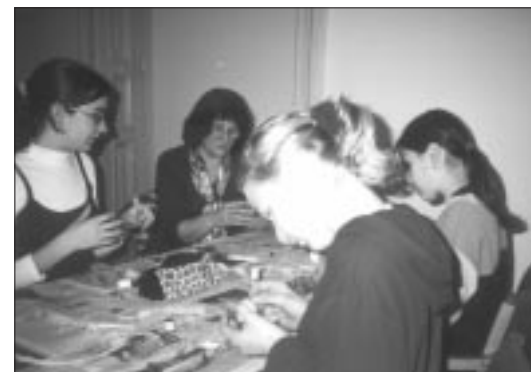
Schülerinnen aus Altofen ...