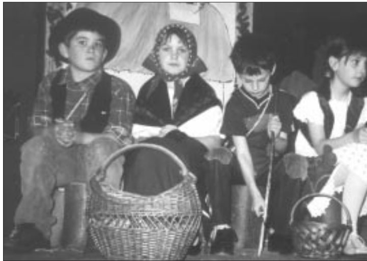
Hänsel und Gretel mit ihren Eltern (Kischlud)

Allen Gewinnern, Teilnehmern, aber auch ihren Lehrern herzlichen Glückwunsch! Das nächste Festival findet in zwei Jahren statt.