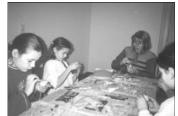
... und Wudersch bei der Arbeit