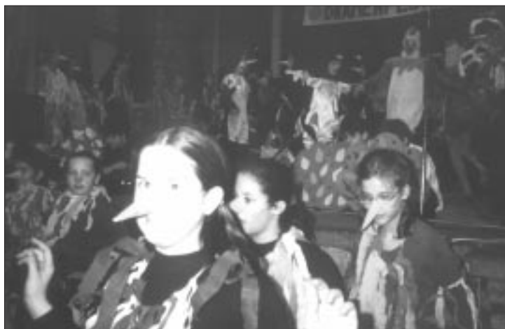
Temperamentvoll lief die Vogelhochzeit über die Bühne