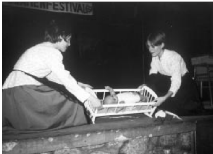
Das Kind wird in der Mundart in den Schlaf gesungen (Herend)