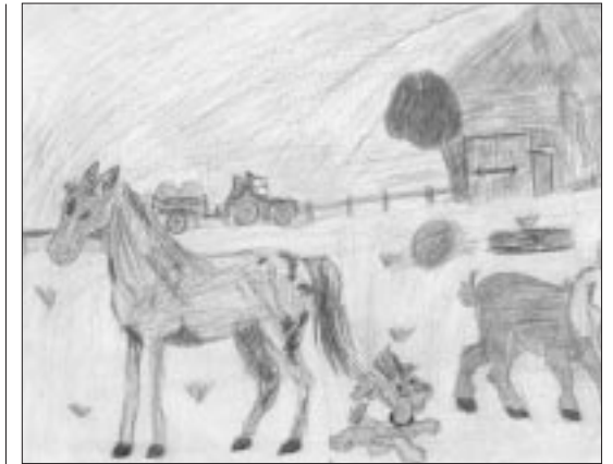
Dávid Gubics, Gyulaffy-Grundschule