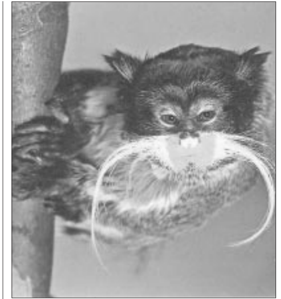
Der Kaisertamarin gehört zu den Krallenäffchen. Er lebt im dichten Amazonaswald.

Mehrere Arten der Kapuzineraffen zeichnen sich durch große Beweglichkeit aus. Sie sind die intelligentesten in diesem Lebensraum. Hier le-