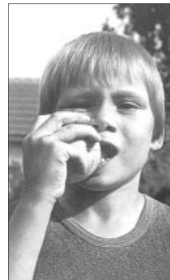
Junge im Zahnwechsel

Süßigkeiten sowie mangelnde Zahnpflege sind Ursachen für Karies. Zuckerhaltige Speisereste bleiben zwischen den Zähnen hängen. Sie bilden einen Nährboden für schädigende Bakterien. Es entstehen Säuren, die den Zahnschmelz entkalken. Nun können Bakterien eindringen und die inneren Teile des Zahnes angreifen. Sie gelangen bis in die Zahnhöhle und verursachen dort schmerzhafte Entzündungen. Kalkarme Ernährung – unzureichende Zufuhr von Milch, Käse, Eiern und grünem Gemüse – beschleunigt den Vorgang.