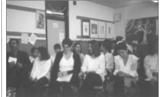
Die Sieben- und Achtkläßler warten gespannt auf ihren „Auftritt“