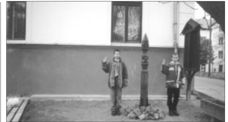
Bei der Einweihung des Gedenkstockes

Mit der Erforschung der Vergangenheit unseres Dorfes werden wir fortfahren, weil wir alles entdecken möchten, um unser kulturelles Erbe zu erweitern.