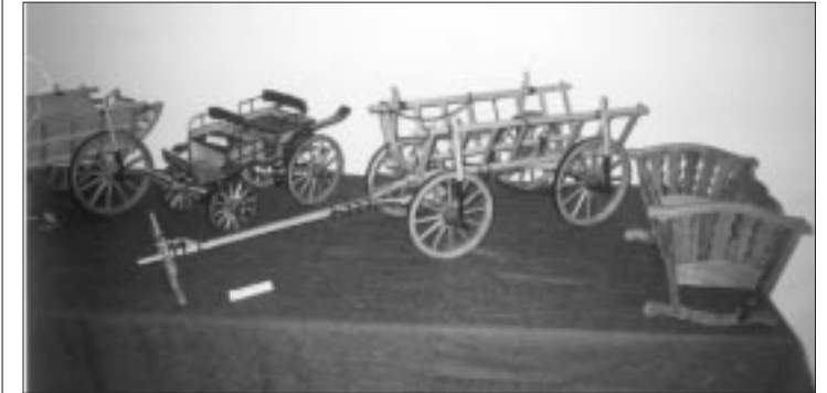
Die Kinder beschäftigen sich mit dem Sammeln alter Gegenstände sowie von Liedern und Bräuchen