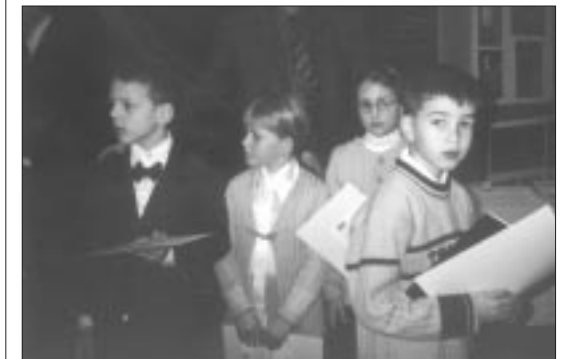
Die vier Besten in der Kategorie 1.-2. Klasse