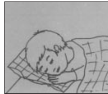
Was träumt Tomi?