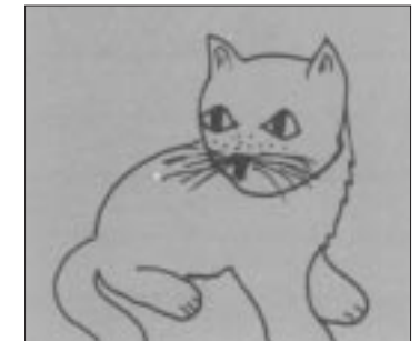
Was hat die Katze entdeckt.