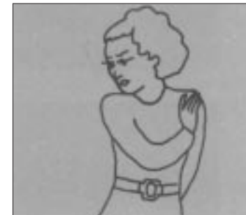
Wovor eckelt sich die Mutter?