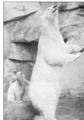
Eisbären sind schöne Tiere

Der in Nordamerika lebende Schwarzbär oder Baribal ist ein kleiner Braunbär , der selten länger als 1,80 m und schwerer als 150 kg wird. Seine Färbung kann schwarz, schokoladenbraun, zimtbraun oder auch weiß sein. Die Schnauze ist meistens braun. Die Pranken sind nicht so massiv wie die der anderen Braunbären. Der Schwarzbär ist darum besonders gewandt und kann ausgezeichnet klettern.