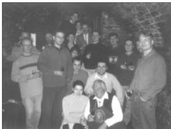
Weinprobe in Gowisch

maliger Bundestagspraktikant, informierte die Teilnehmer des Seminars über die multikulturelle Vergangenheit der Stadt, so auch darüber, daß „lange Jahrhunderte die Deutschen das geistige und kulturelle Leben in Fünfkirchen prägten. Bis Mitte des 19. Jahrhunderts bildeten die Deutschen die Mehrheit, weihten 1837 das Stadttheater mit