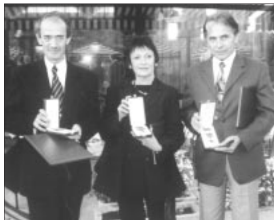
Stevo Popovics, Marta Stangl und Miso Balazs erhielten von Staatspräsident Ferenc Mádl die Auszeichnung Ritterkreuz des Verdienstordens der Republik Ungarn

Zukunftspläne zu sprechen und um zu feiern.