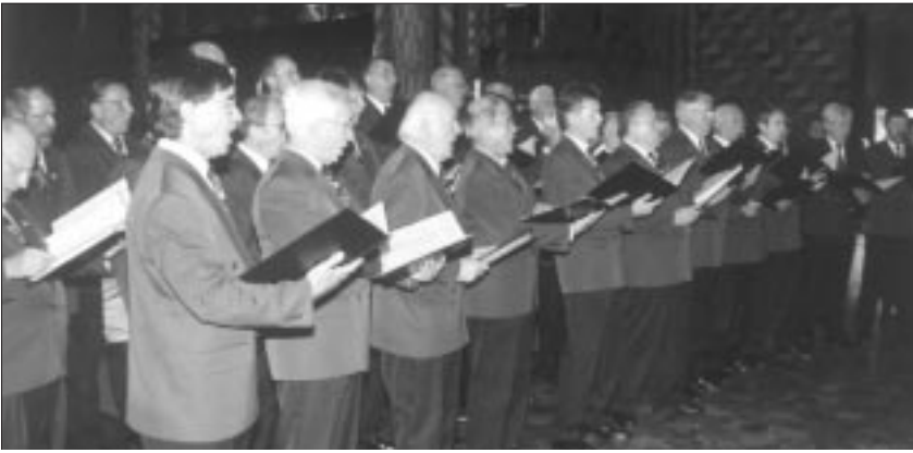
Konzert des Männerchors in der Matthiaskirche