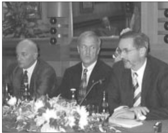
Brandenburgs Ministerpräsident Matthias Platzeck (r.)

Projekte in der Umwelttechnik speziell beim Windkraftanlagenbau sowie der U-Bahn-Bau in Ungarn und die Förderung des Tourismus zwischen Deutschland und Ungarn wurden als weitere Ziele genannt.