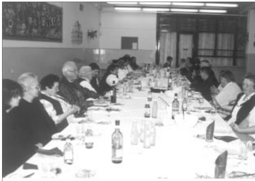
Ein fröhliches Beisammensein der Mitglieder von VUdAK und des Vereins der Wieselburger Deutschstämmigen