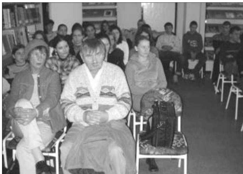
Interessierte Zuhörer im zweisprachigen Kossuth-Gymnasium

Die Autoren und Künstler hatten die Möglichkeit, in Wieselburg-Ungarisch-Altenburg mit Lesungen und einer Ausstellung an die Öffentlichkeit zu treten. Vor interessierten Gymnasiasten lasen die Autoren am Vormittag des 27. September im zweisprachigen Kossuth-Gymnasium (und ließen einige Bücher in der Bibliothek zurück). Am Abend des gleichen Tages gab es in der Aula der Deutschen Nationalitäten-Grundschule Móra Ferenc ein fröhliches Beisammensein mit dem Verein der Wieselburger Deutschstämmigen. Dabei traten die deutsche Tanzgruppe der Schule und der Chor des