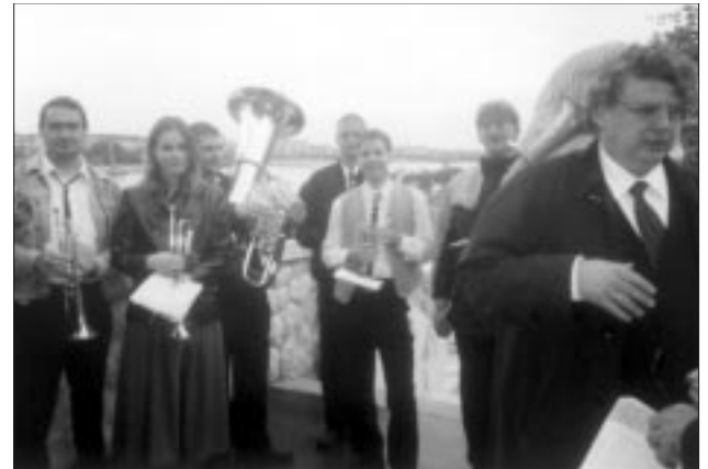
Die Kapelle des Budapester Deutschen Vereins

Das St. Gerhards-Werk Ungarn führte mehrere Landesveranstaltungen durch. Die Ungarndeutschen sind große Marienverehrer. So wird jedes Jahr am 1. Mai eine Landesmaiandacht veranstaltet. Am bedeutendsten ungarischen Nationalfeiertag, am Sankt-Stephanstag am 20. August, nimmt der Verein am Minderheitenfestival und an der Landesprozession um die St. Stephanskirche in Budapest teil. Der Verein ist bei zahlreichen Regional- und Ortsprogrammen und vielen Wallfahrten in Tschowanka/Csobánka und in Einsiedeln/Máriaremete dabei.