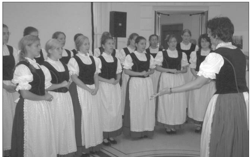
Beim Tag der Europäischen Sprachen der Fremdsprachigen Landesbibliothek trat auch der Chor des Budapester Deutschen Nationalitätengymnasiums auf.