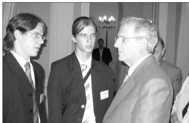
Szabolcs Nuszpl und Tamás Nier mit Staatspräsident Sólyom

Stellvertretend für die gesamte Gruppe von 16 Jungredakteuren des Ungarndeutschen Bildungszentrums Baja nahmen Szabolcs Nuszpl und Tamás Nier aus der Klasse 11 den Preis entgegen und präsentierten in informativer und zugleich amüsanter Weise ihre Erfahrungen, die sie mit den deutschen Partnern und den Umweltprojekten machten.