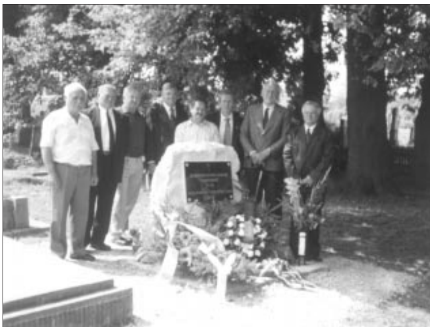
Auf dem alten Friedhof von Sirtz/Zirc steht seit dem 17. August der Gedenkstein an die verstorbenen Siedler

Der Vorsitzende der Selbstverwaltung kandidiert erneut. Er will für die Deutschen, für die Pflege der deutschen Kultur in Theresienstadt noch einiges tun. Z. K.