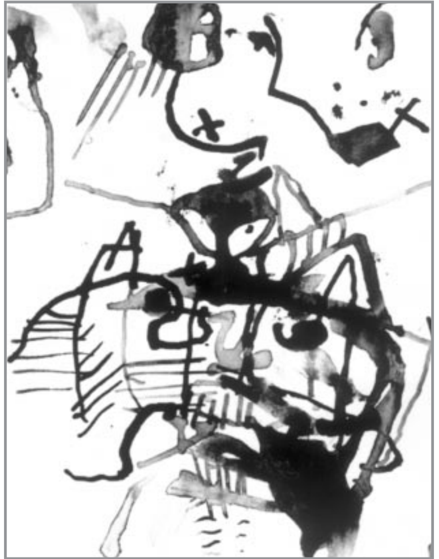
Idyll 2, 1999