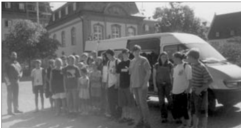
Vor dem Landtag in Mainz