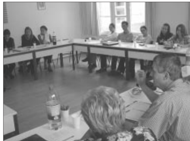
Landesratssitzung im UBZ von Baja

Bedeutung. Der Inhalt der Arbeit in den derzeit offiziell 15 aktiven Freundeskreisen ist bislang hauptsächlich von Sportveranstaltungen bis hin zu Tanzgruppen geprägt. Darüber hinaus wurde über die Anregung fachspezifischer Projekte wie Schreib- bzw. Literaturseminare, -wettbewerbe nachgedacht. Junge Leute sollten dabei persönlich von Künstlern lernen und anschließend ihr Können untereinander zur Schau stellen. Erkennbar hartnäckig zeigte sich das Präsidium bei seinem Ziel, die Erfolgsskala bisheriger lokaler Tätigkeiten, landesweiter Programme und zukünftiger Ereignisse wieder spürbar anzuheben (was sich am Ende vor allem in der Zahl neuer Mitglieder widerspiegeln soll). Außerdem erwarte man von den derzeit etwa 400 Vereinsmitgliedern, daß sich die Zahl der tatsächlich Aktiven nach oben steigert. Ein erhöhtes