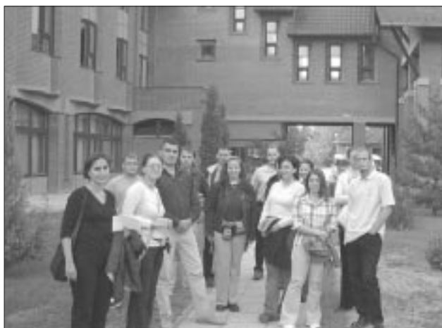
Vor der Abfahrt nach Hajosch

Die Erfahrungen der einzelnen Freundeskreise über deren mehr oder minder erfolgreiche Tätigkeiten regten schließlich eine Grundsatzdebatte über die derzeitige Struktur der GJU an. Wie die Arbeit in den einzelnen, selbständig organisierten Vereinen verbessert werden könne, war dabei ein ebenso wichtiges Thema wie die Frage, wie man junge Leute bereits frühzeitig an die GJU heranführen solle. Dabei stellten sich vor allem die Gymnasien als idealer Ort heraus, die als starke Einheit für die GJU gewonnen werden müßten. Neben der Arbeit an den Schulen ist zukünftig auch eine verstärkte Ausbreitung der Aktivitäten an den Unis von hoher