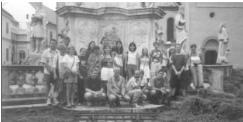
In der Burg von Wesprim

Am 17. August fuhr eine Gruppe – die meisten davon sind Angehörige der deutschen Minderheit – mit dem