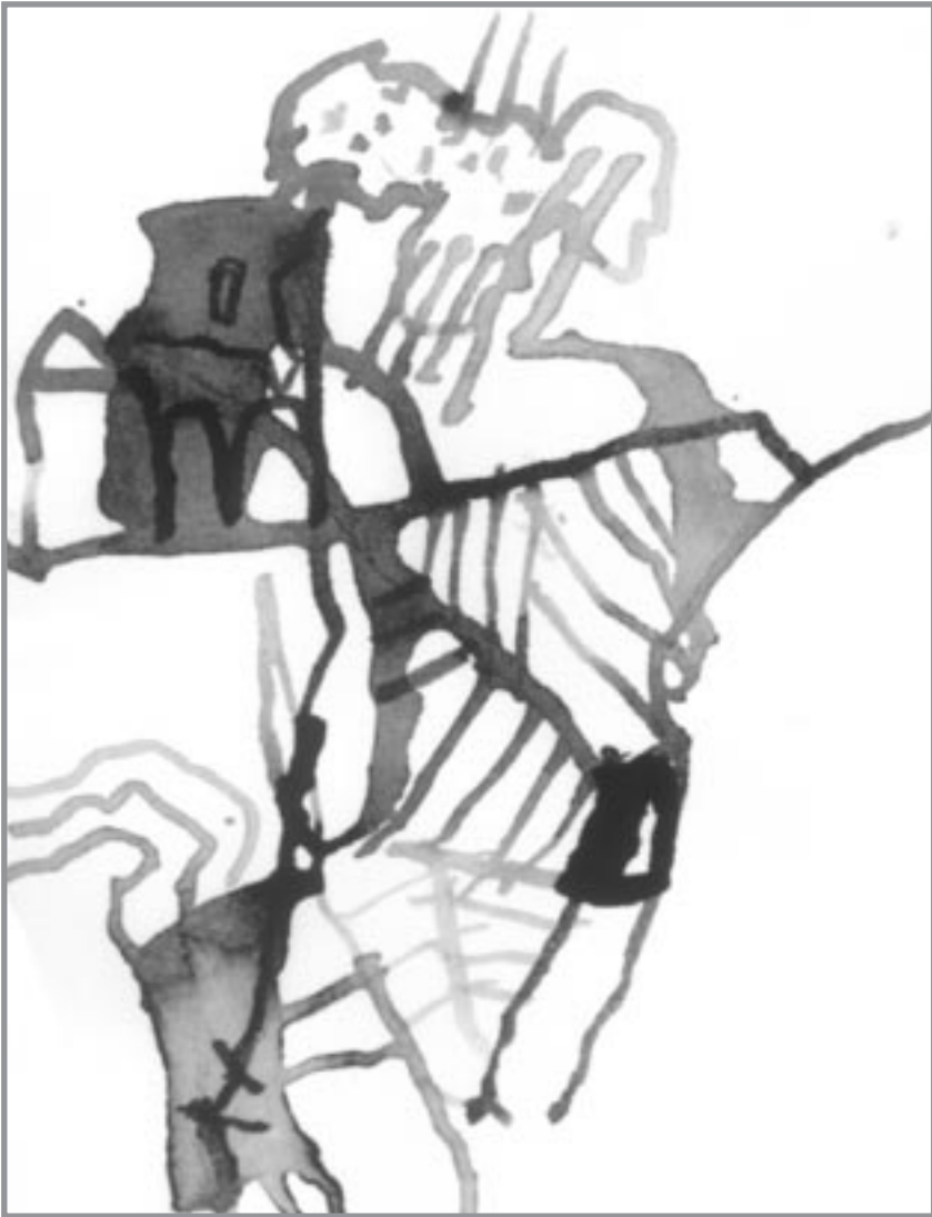
Auf dem Jutaberg in Schorokschar, 1999 Brennende Thaling-Brücke, 1999