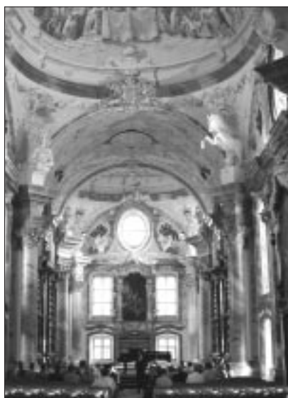
In der Bibliothek des Benediktinerstifts in Altenburg