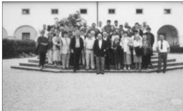
Die Sing- und Tanzgruppe aus Ketsching im ehemaligen Stift Waldhausen