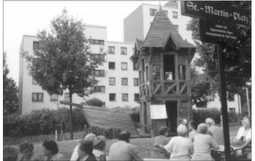
Die Ulmer Schachtel in Vellmar

Die Einweihung des Denkmals und das Programm unserer Tanzgruppe und Blaskapelle verfolgten natürlich