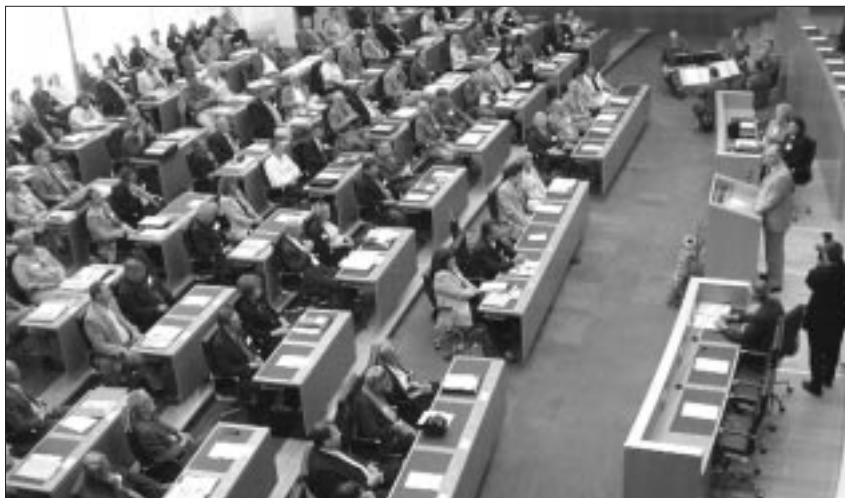
Landeshauptmann Pröll und die ANÖ im Landhaus von St. Pölten