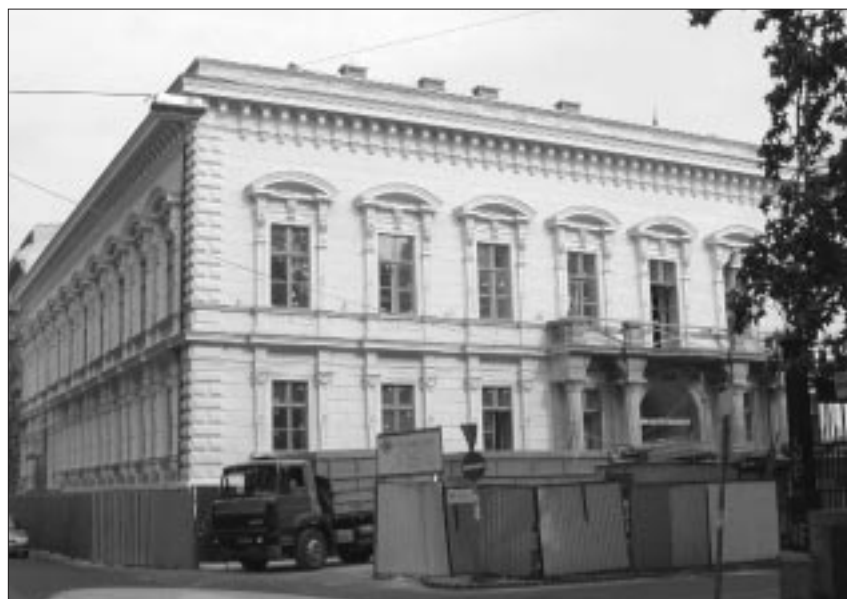
Das künftige Gebäude der Universität