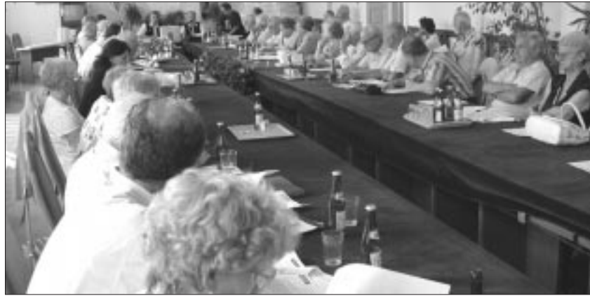
Die Vollversammlung wählte einstimmig die deutschen Kandidaten

Besonders Wertvolles geleistet hatte der Verein in der Wiederherstellung wichtiger Denkmäler im Bezirk (Heilige Dreifaltigkeitsstatue, Kurtzkreuz, Kleinzeller Kalvarie). Die Pflege von städtepartnerschaftlichen Kontakten ist nicht nur für den Braunhaxler-Verein, sondern auch für Altofen-Krottendorf sehr wichtig. Im Interesse dessen stattete die Vereinsführung zusammen mit dem Bürgermeister des III. Budapester Bezirks István Tarlós und mehreren Selbstverwaltungsabgeordneten im Jahre 2001 einen Besuch in Billigheim-Sulzbach ab, wo konkrete Verhandlungen vor allem über die Zusammenarbeit im Unterrichtsbereich geführt wurden. Das hält der Verein für sehr wichtig, da er auch auf diesem Wege die Kontakthaltung der kommenden Generationen zwecks Pflege der Kultur, Sprache und Traditionen fördern und sichern will.