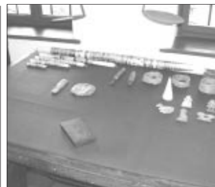
Das Nadascher Heimatmuseum war das erste dieser Art in Ungarn