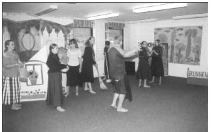
und Zeit der deutschen Kolonisten