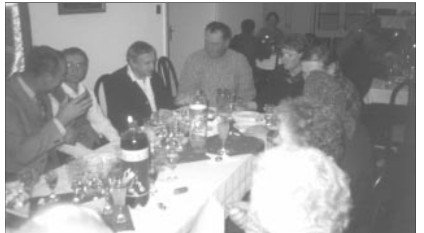
Geburtstagsfeier früher in der Begegnungsstätte