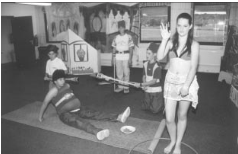
In der Sage über die Peskő-Höhle die Türkenzeit...