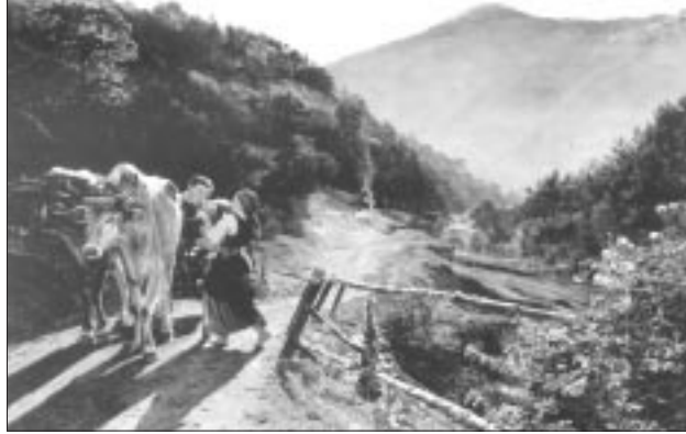
Ölbild von Ferdinand Georg Waldmüller (1793 – 1865), „Die Rosenzeit“. Typische Wienerwaldlandschaft. Im Hintergrund ist ein rauchender Kohlenmeiler zu erkennen

Es gibt wohl nicht viele Millionenstädte auf der Welt, wo sich ein Waldgebiet bis in die Mitte der Stadt hinein erstreckt. Die österreichische Hauptstadt Wien ist in dieser glücklichen Lage und blickt heute voll Stolz auf seinen „Wienerwald“. Seine Gesamtfläche beträgt 125.000 Hektar, oder 1.250 Quadratkilometer, die zum größten Teil im Bundesland Niederösterreich liegen. Im Norden wird der Wienerwald von der Donau und der Ebene des Tullnerfeldes begrenzt, parallel dazu im Süden von den Tälern der Gölsen und der Triesting, im Westen vom Fluß Traisen und im Osten von der sogenannten Thermenlinie, eine geologische Abbruchlinie, an deren nördlichem Punkt die Stadt Wien liegt. Schon in der Altsteinzeit suchten sich die Menschen ihre bequemeren Wanderwege in diesen Grenzgebieten und mieden den undurchdringlichen Urwald. Auch die Römer errichteten ihre Befestigungsanlagen an den Rändern des neu eroberten keltischen Königreichs Noricum und zogen nur kleine Stichstraßen in den Wald hinein. Die Reitervölker der Völkerwanderungszeit, die Awaren, die Slawen, die Magyaren ... ließen den Wald Wald sein, und erst um das Jahr 1000 wurde das Gebiet durch Lehen und Königsschenkungen sowie durch Klostergründungen im Hinblick auf zukünftige Einflußnahme aufgeteilt.