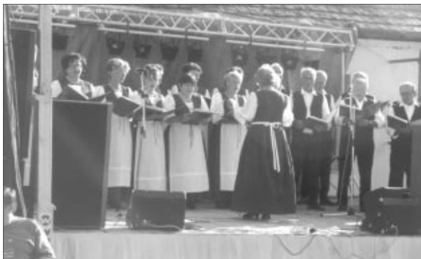
Der Nationalitätenchor von Berkina feiert im nächsten Jahr sein 20jähriges Bestehen