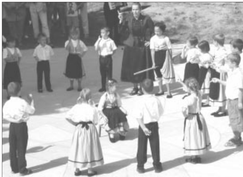
Die Kindergartenkinder verzauberten mit ihrer zarten Stimme und ihren kleinen Trachten die Zuschauer

Ein Höhepunkt des Festes war der Auftritt der Kindergartenkinder, die mit ihrer zarten Stimme und ihren kleinen Trachten die Zuschauer verzauberten. Tolle Stimmung machten die Musikanten aus Eckartsweier. Die Partnerschaft zu diesem baden-