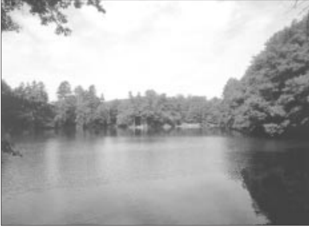
Landschaft bei Mauerbach im Sandsteinwienerwald