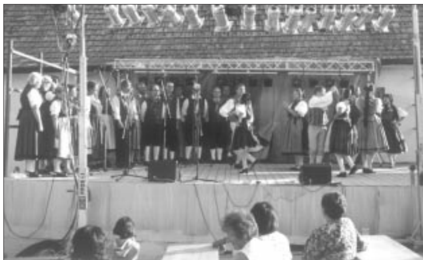
Ansprechendes Programm boten der Chor und die Tanzgruppe aus Neuhaus am Rennweg

kina, der im nächsten Jahr sein 20jähriges Bestehen feiert, und die frisch gegründete Jugend-Tanzgruppe von Berkina eröffneten das Kulturprogramm. Ihnen folgte das ansprechende Programm des Chores und der Tanzgruppe aus Neuhaus am Rennweg. Die Takser Musikanten sorgten bis in die Nachtstunden für weitere gute Laune.