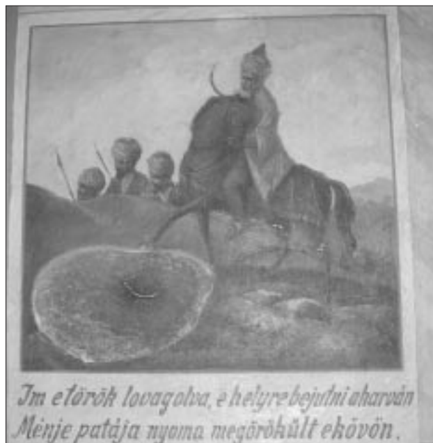
Darstellung der Erscheinung von Maria dem türkischen Eroberer, dessen Pferd vor Schreck einen Abdruck seines Hufs im Felsen hinterlassen hat