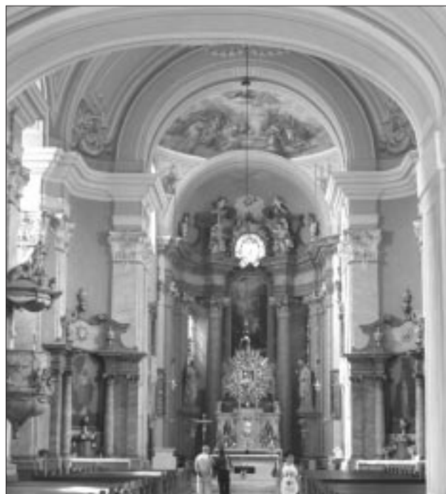
Der Altarraum der Basilica