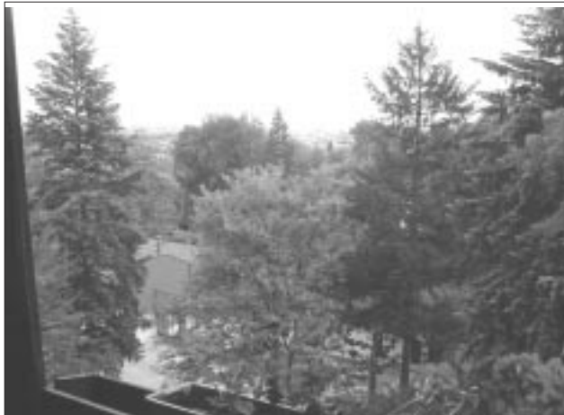
Aussicht aus der Villa Waschludt

Das Waschludter Kinderlager war seit eh und je ein Sorgenkind der jeweiligen Besitzer. Als nach der politischen Wende der neugewählte Gemeinderat von Waschludt/Városlöd Anfang der neunziger Jahre die Besitzerrechte an dem in einem wunderschönen Arboretum gelegenen Camp untersuchte, mußte er mit Staunen feststellen, daß das Objekt gar nicht Waschludt, sondern Balatonalmádi gehörte. Bald folgten der Rückkauf und das böse Erwachen: das Lager brachte der Gemeinde jährlich einen Verlust von einer Million Forint ein. Während der damalige und heutige Bürgermeister Károly József die Ge-