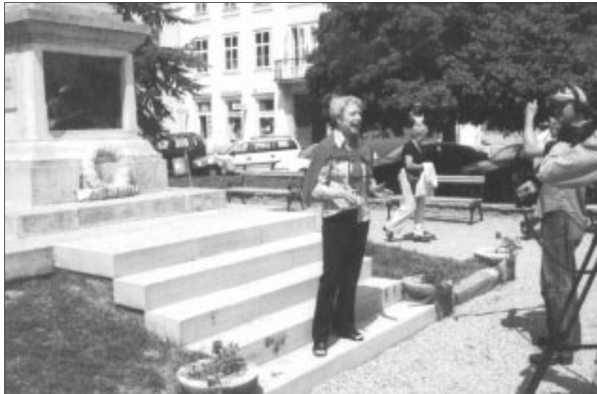
Dreharbeiten auf dem Széchenyi-Platz in Ódenburg

Vorgestellt werden in der Sendung auch die Jugendblaskapelle Ódenburg und die deutschsprachige Kindergartengruppe in Wandorf, bei der eine Erzieherin aus Burgenland die zweisprachige Erziehung unterstützt. Einen wichtigen Schauplatz bildet auch der Nationalpark Neusiedler See. Ins Bild kamen die Saisonöffnung der Segelbootregatta, die museale Schmalspureisenbahn Großzinkendorf/Nagycenk und die Ortschaften