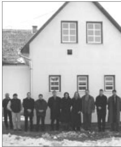
Haus: Gäste bei der Einweihung

Ein Gebäude in einem echten ungarndeutschen Ort, wo noch Traditionen auffindbar sind, wo die Mundart noch zu hören ist und wo eine geeignete Infrastruktur geboten