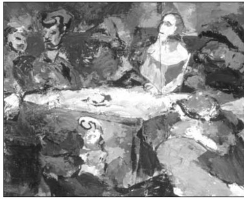
Tisch von Mozart

Auch die Musik von Mozart entdeckte Károly Wilhelm schon früh für sich, wenn er in seinem Atelier arbeitete. Er benötigte kein internationales Jubiläumsjahr, um sich malerisch mit dem unsterblichen Komponisten zu beschäftigen. Beweise dafür sind ein halbovales, barock-