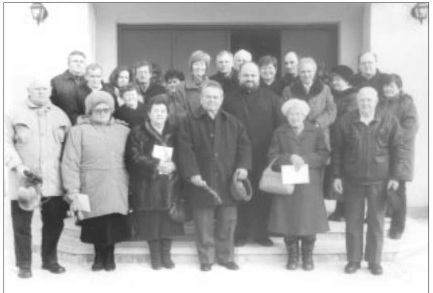
Jubilierende Ehepaare vor der Wetschescher Kirche

„Ja, die beiden haben sich in der Kriegsgefangenschaft in Rußland kennengelernt. Der Mann ist einer aus Großmarosch.“