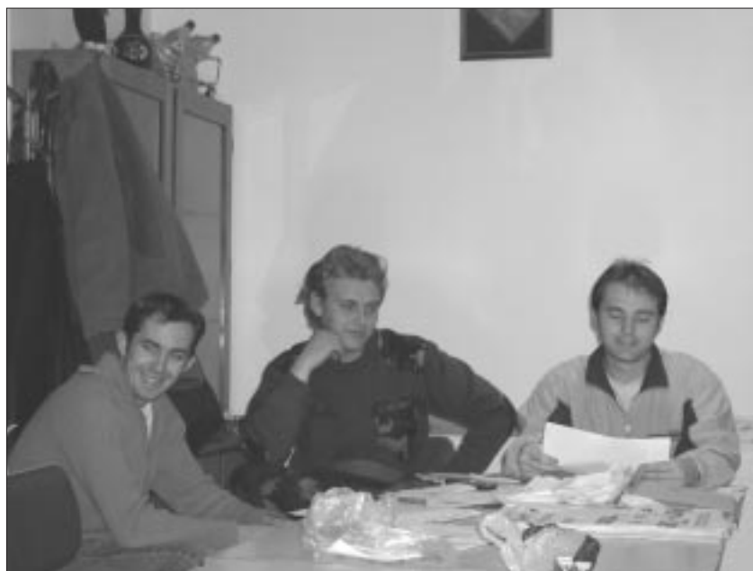
Das neue Präsidium bei den Vorbereitungen des Fußballturniers 2003