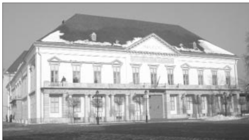
Am Sándor-Palast wird noch gewerkelt