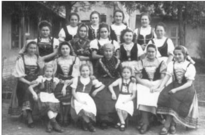
Theaterstück in den 40er Jahren.

Unterricht, Porträts von Kriegsteilnehmern, die nie zurückkamen, Volkstracht und öffentliches wie Ver-