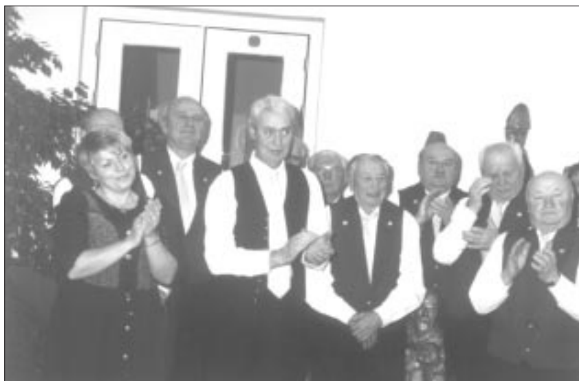
Auch den Sängern gefiel die Ausstellung