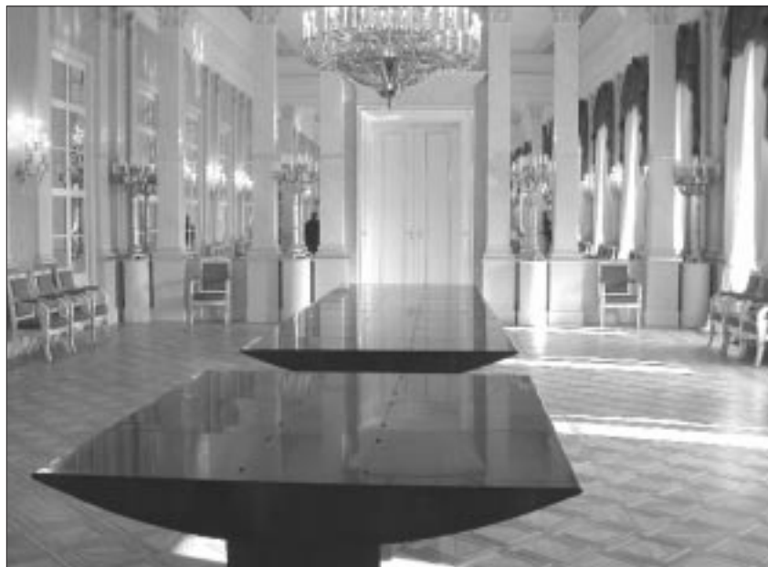
Der Tisch – vorgesehen für die Sitzungen des Ministerrates – wird im Spiegelsaal nicht mehr gebraucht