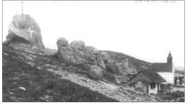
Das Kreuz auf dem Steinberg, das nach 1945 zur Eisensammlung abgetragen wurde. Heute steht es wieder Dank den Spenden vertriebener Wuderscher.