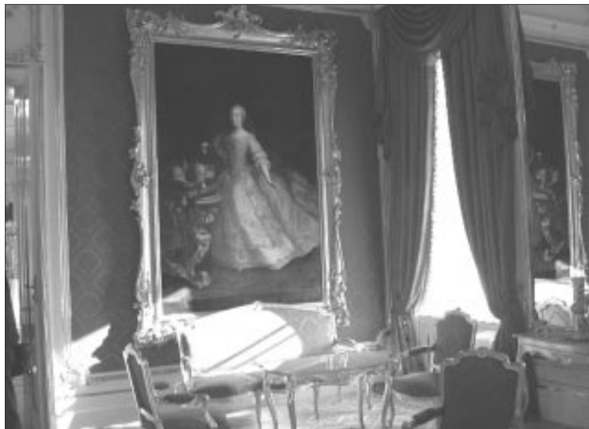
Blick in den Maria-Theresia-Salon

Die Inbetriebnahme des Informatiksystems ist wegen technischer Unzulänglichkeiten noch im Gange. So ist das Amt des Staatschefs noch nicht in den neuen Sitz, in den Sándor-Palast, umgezogen, dieser wurde aber vom Amt bereits in Besitz genommen. Der neoklassizistische blaue Salon des Palais wird Staatspräsident Ferenc MádI als Raum für Gespräche in engem Rahmen nutzen. Vom blauen Salon führt der Weg durch den Maria-Theresia-Salon in den Spiegelsaal, wo die Überreichung von Ernennungen und Auszeichnungen sowie die Entgegennahme von Akkreditierungsschreiben oder auch Fest-