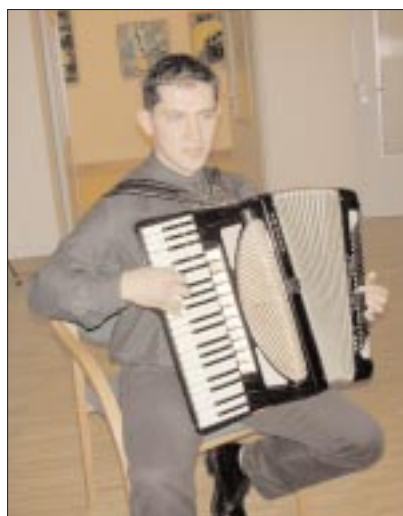
Musikalische Umrahmung: Árpád Wieszt

Die Ausstellung von Gyula Frömmel ist im Haus der Ungarndeutschen (Budapest VI., Lendvay utca 22) bis zum 14. Februar Montag bis Freitag 9-18 Uhr zu besichtigen.