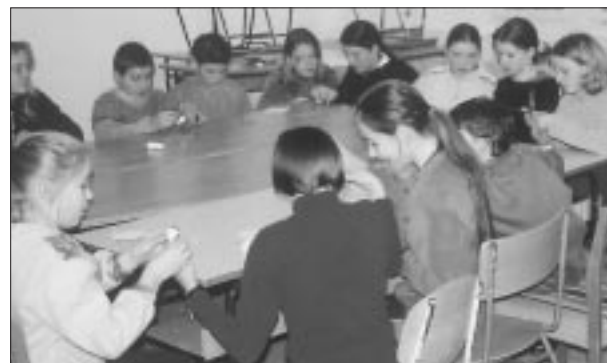
Das Herstellen von Perlketten macht Spaß

Wir danken dir für dieses Gespräch! Ich meine, daß dies für einige Jugendliche eine gute Lehre sein kann.