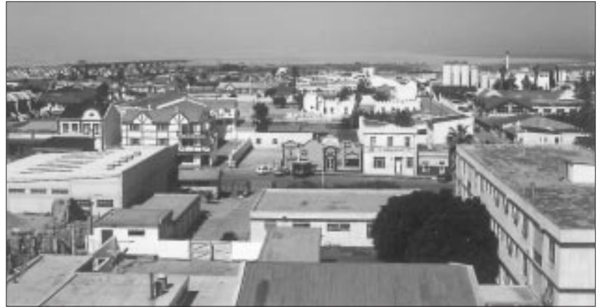
Blick auf Swakopmund

Im Zentrum der namibischen Küstenstadt Swakopmund sucht man seit wenigen Wochen vergeblich nach den berühmten deutschen Straßenschildern, die ein Überbleibsel aus der deutschen Kolonialzeit waren und für viele Touristen eine wichtige Attraktion darstellten. Die Kaiser-Wilhelm-Straße, die Flaniermeile des von deutscher Architektur dominierten Badeortes wurde in Sam-Nujoma-Avenue umbenannt. Sam Nujoma ist der schwarze Ministerpräsident Namibias. Er nahm die Umbenennung der Straße persönlich vor. Viele deutschstämmige Bürger Swakopmunds protestierten vergeblich gegen die Umbenennung von insgesamt 14 Straßen und die Selbstbewehräucherung, die ihr Ministerpräsident betreibt. (IMH)