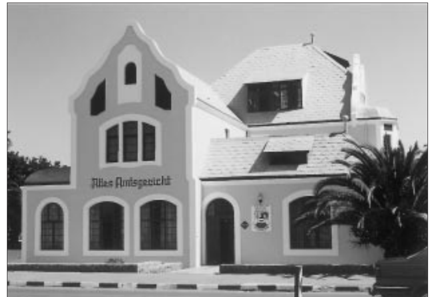
Aufschrift aus der Kolonialzeit

Im Zentrum der namibischen Küstenstadt Swakopmund sucht man seit wenigen Wochen vergeblich nach den berühmten deutschen Straßenschildern, die ein Überbleibsel aus der deutschen Kolonialzeit waren und für viele Touristen eine wichtige Attraktion darstellten. Die Kaiser-Wilhelm-Straße, die Flaniermeile des von deutscher Architektur dominierten Badeortes wurde in Sam-Nujoma-Avenue umbenannt. Sam Nujoma ist der schwarze Ministerpräsident Namibias. Er nahm die Umbenennung der Straße persönlich vor. Viele deutschstämmige Bürger Swakopmunds protestierten vergeblich gegen die Umbenennung von insgesamt 14 Straßen und die Selbstbewehräucherung, die ihr Ministerpräsident betreibt. (IMH)