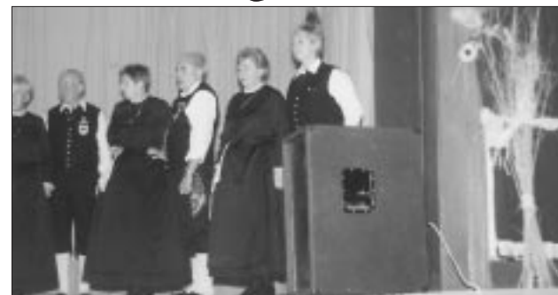
Authentische Tänze der Siwatzter

So gut gestärkt ging die Fahrt auf abenteuerlicher Straße in das Kulturhaus des Ortes. Dort erwartete die Reisegruppe ein einzigartiges Programm. Vier Altersgruppen von Tänzerinnen und Tänzern begeisterten ihr Publikum mit deutschen und ungarischen Rhythmen, perfekt vorgeführte künstlerische Choreographie. Anschließend trug ein gemischter Chor von etwa 30 Sängern deutsche und ungarische Lieder vor. Und