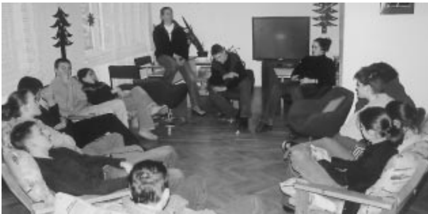
Hart und langwierig war die Diskussion um die Gestaltung dieser Kindersilvesteraufgabe